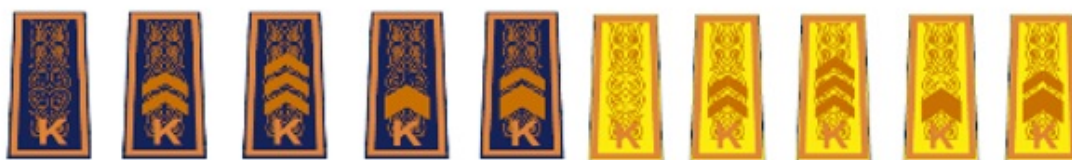
қысқы күртешелерге және арнайы киім-кешекке