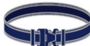
арнайы пішіндегі белбеу