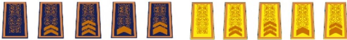
қысқы күртешелерге және арнайы киім-кешекке