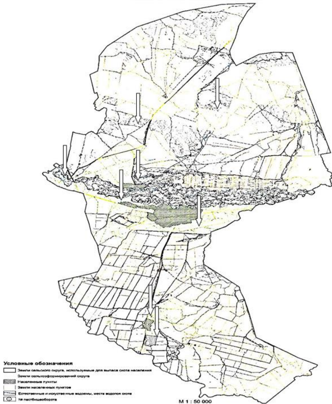
СХЕМА использования пастбищ по Курчумскому сельскому округу (село Курчум, Топтерек, Алгабас)

Күршім ауылдық округі бойынша жайылымдарды басқару және оларды пайдалану жөніндегі 2021-2022 жылдарға арналған жоспарға 5 қосымша