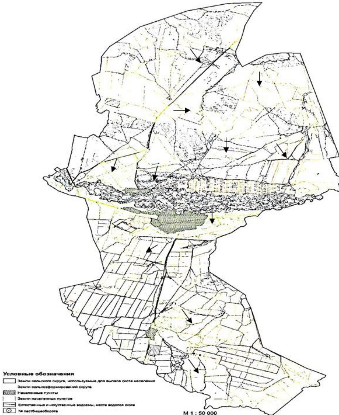
СХЕМА использования пастбищ по Курчумскому сельскому округу (село Курчум, Топтерек, Алгабас)