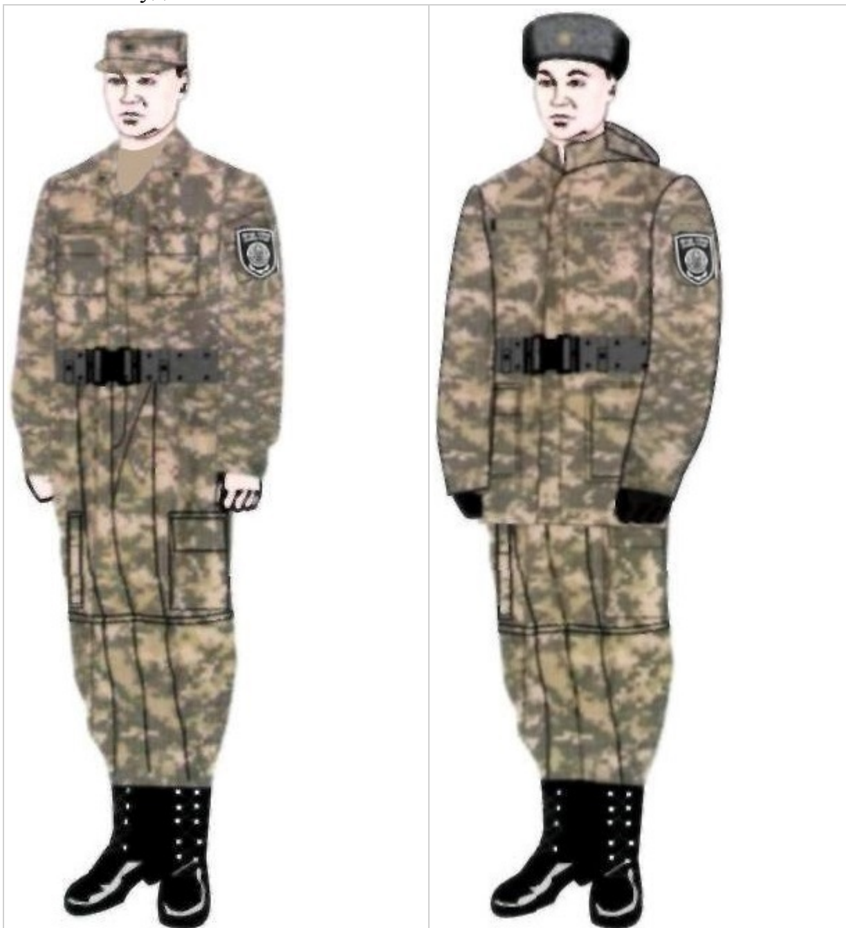
22-сурет. Сыбайлас жемқорлыққа қарсы қызмет қызметкерлерінің жазғы далалық нысаны

8) жедел-тергеу бөлімшелерінің қызметкерлеріне арналған қара түсті жамылғы-кеудеше.