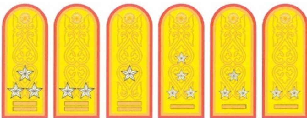
Аға және орта басшы құрамның салтанатты погондары (28-сурет).

1) салтанатты, жазғы-салтанатты және күнделікті погондар (28, 29, 30-суреттер).