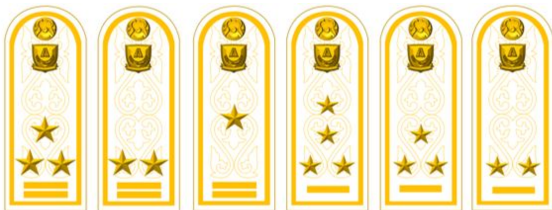
Аға және орта басшы құрамның салтанатты жазғы погондары (29-сурет).