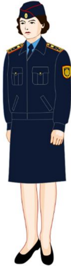
17-1. Аға және орта басшы құрамның (әйелдің) күнделікті нысанды киімі