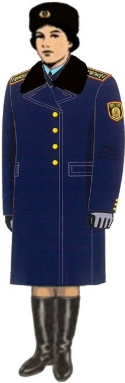
18-сурет. Аға және орта басшы құрамның қысқы нысанды киімі (әйелдер)