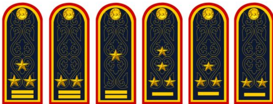
Аға және орта басшы құрамның күнделікті погондары (30-сурет).