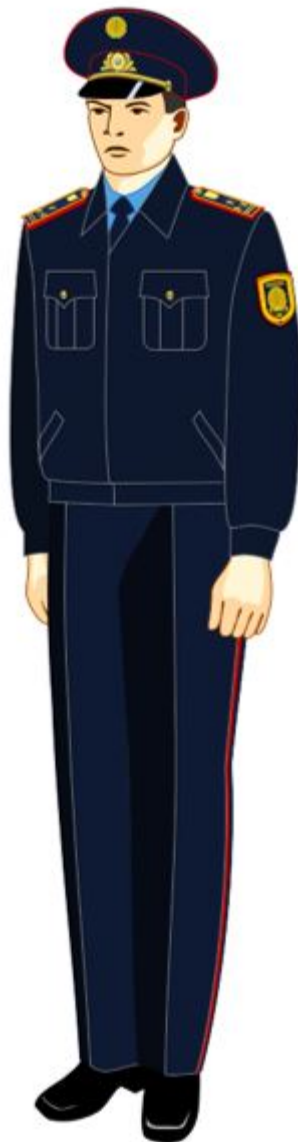
11-1. сурет. Аға және орта басшы құрамның күнделікті нысанды киімі