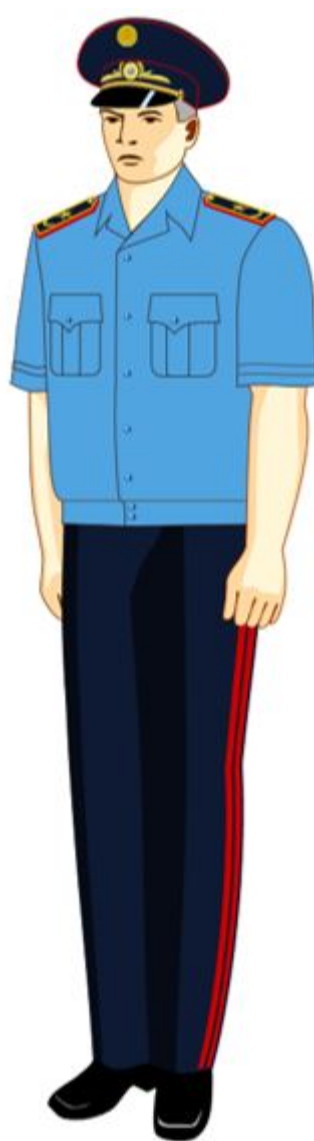
8-сурет. Жоғары басшы құрамның жазғы нысанды киімі

2. Аға және орта басшы құрамның лауазымдарына арналған нысанды киімі (ерлерге):