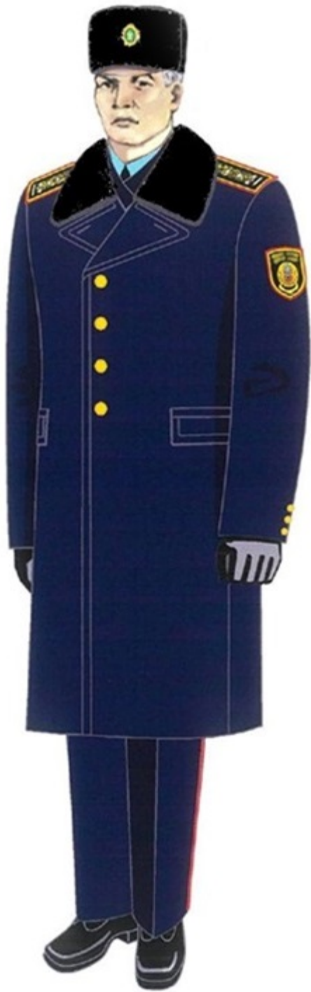
12-сурет. Аға және орта басшы құрамның қысқы нысанды киімі