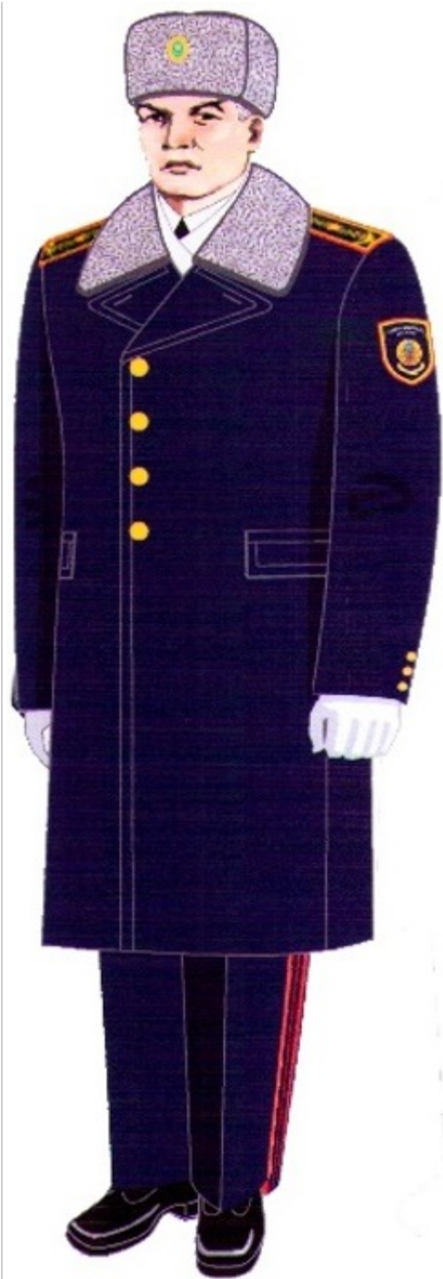
6-сурет. Жоғары басшы құрамның күнделікті қысқы нысанды киімі