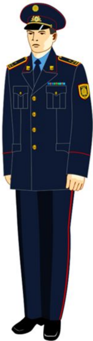
11-сурет. Аға және орта басшы құрамның күнделікті нысанды киімі