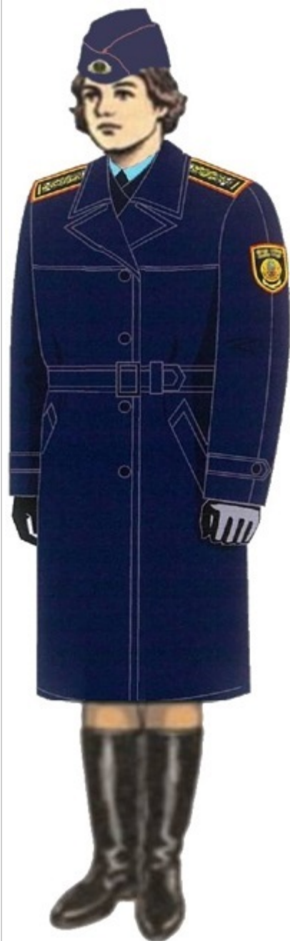
19-сурет. Аға және орта басшы құрамның маусымдық нысанды киімі (әйелдер)