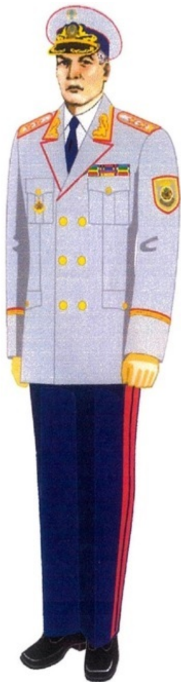
1-сурет. Жоғары басшы құрамның салтанатты-парадтық нысанды киімі