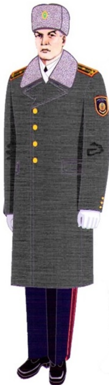
2-сурет. Жоғары басшы құрамның қысқы салтанатты-парадтық нысанды киімі