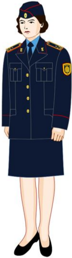
17-сурет. Аға және орта басшы құрамның (әйелдің) күнделікті нысанды киімі