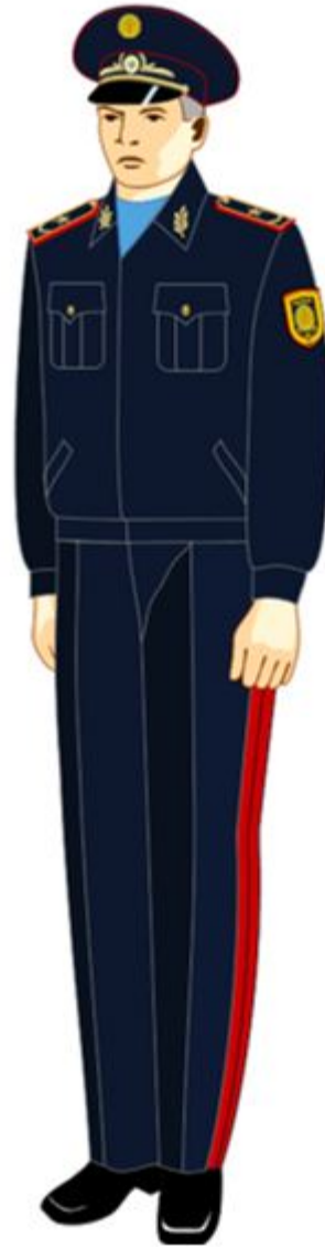
11-1-сурет. Жоғары басшы құрамның күнделікті нысанды киімі.