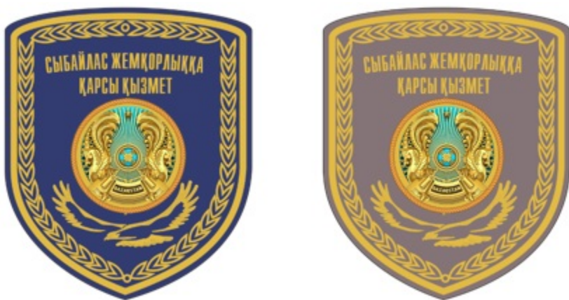
Жоғары басшы құрамның лауазымдарына арналған жең белгісі (27-сурет).

6.2. Аға және орта басшы құрам лауазымдарына арналған айырым белгілері: