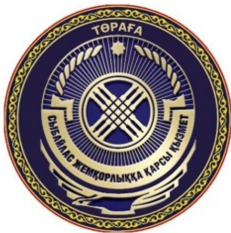
Сыбайлас жемқорлыққа қарсы қызмет басшысының жең белгісі (26-сурет).