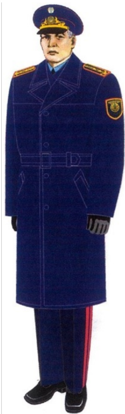
7-сурет. Жоғары басшы құрамның маусымдық нысанды киімі