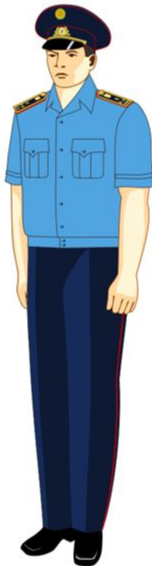
14-сурет. Аға және орта басшы құрамның жазғы күнделікті нысанды киімі

3. Аға және орта басшы құрамының лауазымдарына арналған нысанды киімі (әйелдер):