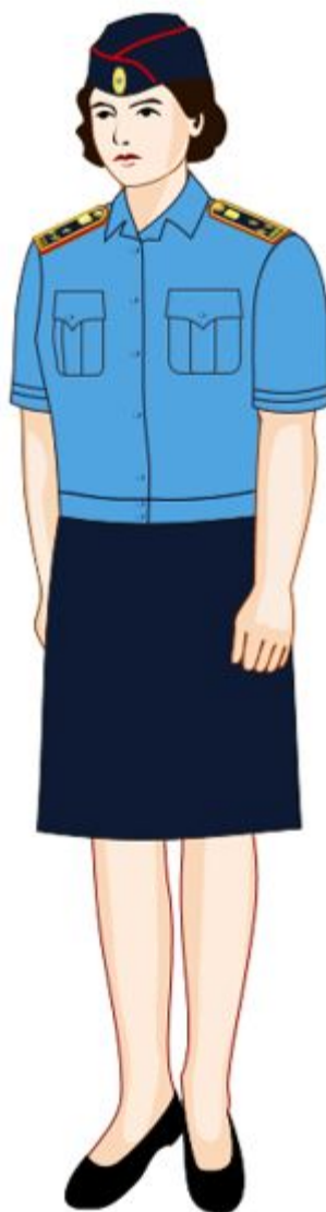
20-сурет. Аға және орта басшы құрамның (әйелдердің) жазғы күнделікті нысанды киімі

4. Кезекші бөлімнің, айдауыл қызметі және жедел ден қою бөлімшелерінің қызметкерлеріне арналған далалық нысанды киім (21-сурет):