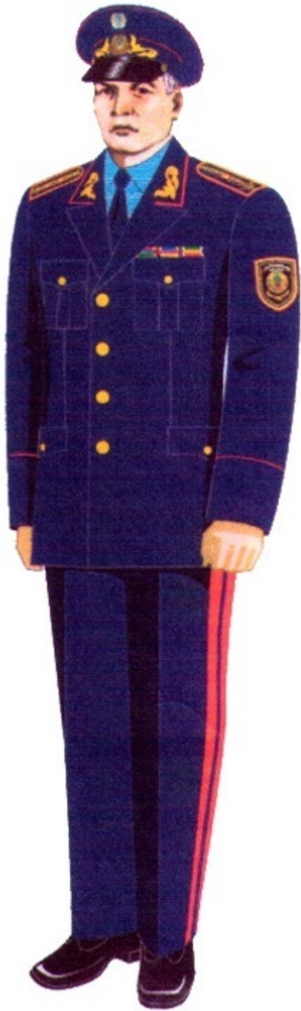
5-сурет. Жоғары басшы құрамның күнделікті нысанды киімі