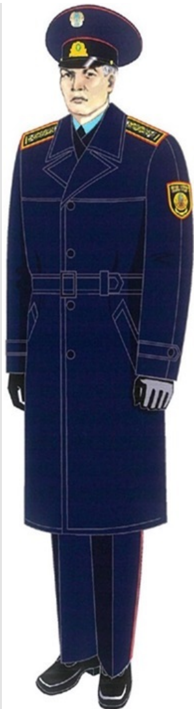
13-сурет. Аға және орта басшы құрамның маусымдық нысанды киімі