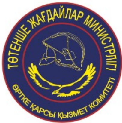
өртке қарсы қызмет комитетінің қызметкерлеріне арналған жеңдік белгі