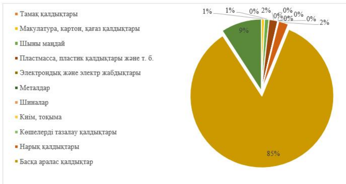
Диаграмма 2 - Бұқар жырау ауданы бойынша жиналған және тасымалданған қалдықтардың түрлері бойынша арақатынасы