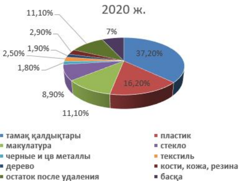
Сурет 2. ҚР бойынша ҚТҚ морфологиялық құрамы (2020ж.)

МДЗТ (2020 ж.) зерттеуіне сәйкес республика бойынша ҚТҚ морфологиялық құрамының орташа көрсеткіштері келесідей: тамақ қалдықтары (37,2), пластик (16,2%), макулатура (11,1%) (2-сурет). Бұл ретте, едәуір бөлігі (11%) компоненттерді (ұсақ құрылыс қоқыстары, тастар, көше сметалары және т.б.) алып тастағаннан кейін коммуналдық қалдықтардың қалдықтарына жатқызылды. Коммуналдық қалдықтардың морфологиялық құрамын зерттеу қажет (1-сурет).