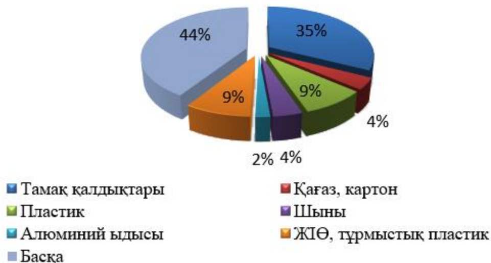
Сурет 1. Қарқаралы ауданының ҚТҚ морфологиялық құрамы

МДЗТ (2020 ж.) зерттеуіне сәйкес республика бойынша ҚТҚ морфологиялық құрамының орташа көрсеткіштері келесідей: тамақ қалдықтары (37,2), пластик (16,2%), макулатура (11,1%) (2-сурет). Бұл ретте, едәуір бөлігі (11%) компоненттерді (ұсақ құрылыс қоқыстары, тастар, көше сметалары және т.б.) алып тастағаннан кейін коммуналдық қалдықтардың қалдықтарына жатқызылды. Коммуналдық қалдықтардың морфологиялық құрамын зерттеу қажет (1-сурет).