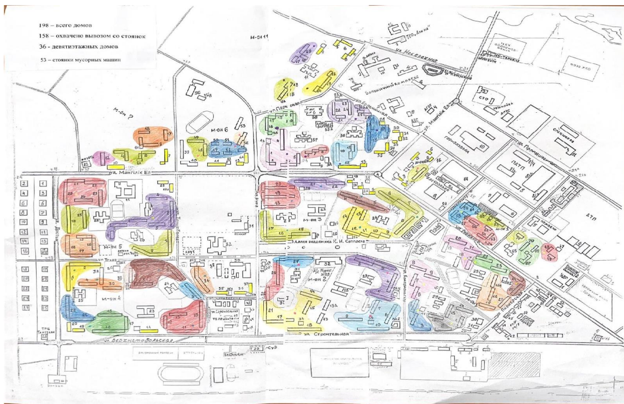
1-сурет. Қалдықтарды контейнерсіз жинау барысында мамандандырылған көліктердің тұрақ орындары

қауіпті қалдықтарды; ірі көлемді қалдықтарды (ұзындығы, ені немесе биіктігі 0,5 м асатын) жинауға арналған, арнайы жабдықталған 5 контейнерлік алаң бар.