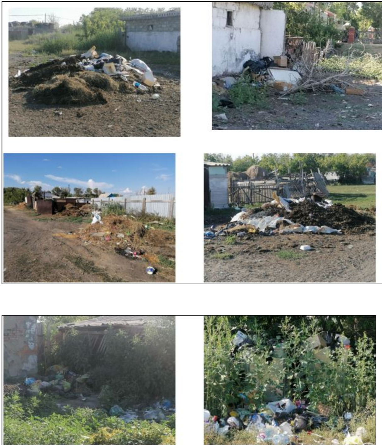
5-10 сурет. Қамысты, Алтынсарин, Ливановка ауылдарындағы аулаларда халықтың қалдықтарды жинауы

Пластмасса, қағаз, картон, қалайы банкалар сұрыпталмайды, ҚТҚ полигонына әкетілетін қалдықтар аралас түрде түседі. ҚТҚ полигондарында қалдықтарды көму қалдықтарды алдын ала сұрыптаусыз да жүзеге асырылады.