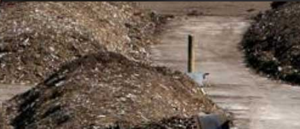
17 сурет. Коммуналдық қалдықтардың сұрыпталған "дымқыл" фракциясын компосттауға арналған алаң