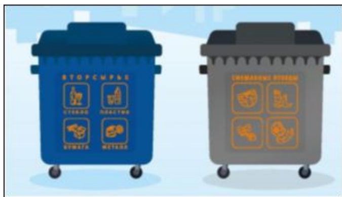
16 сурет. "Құрғақ" және "Дымқыл" фракцияларды бөлек жинауға арналған контейнерлер