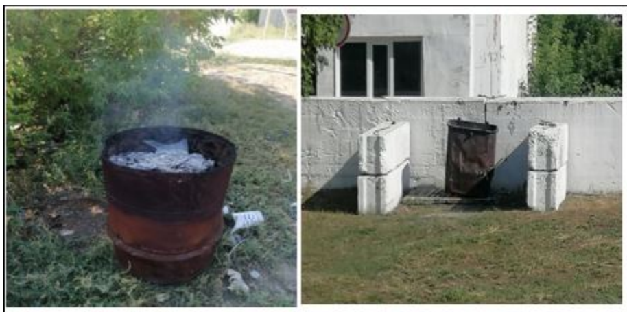
3-4 сурет. Қамысты ауылындағы сауда нүктелерінде қалдықтарды жағу

- полимерлер-пластикалық ыдыстар, полиэтилен пакеттер және т.б. қайта пайдаланылады немесе тұрмыстық пештерде, металл контейнерлерде жағылады немесе ҚТҚ полигонына орналастырылады.