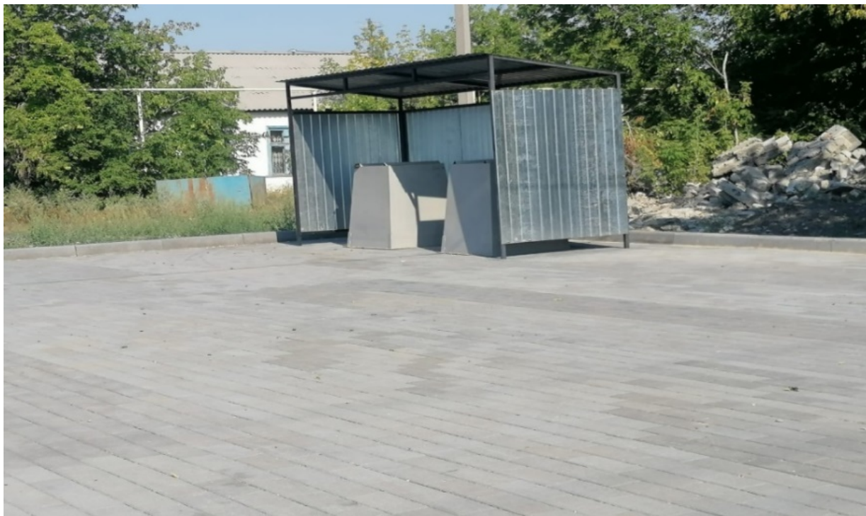
20 сурет. Қамысты ауылындағы контейнерлік алаң

Сондай-ақ, контейнер алаңының үстіне атмосфералық жауын-шашынның контейнерге түсуіне және қалдықтардың салмағын артуына жол бермейтін шатырды орнату ұсынылады. Контейнерге су түскен жағдайда контейнердің салмағы артады және бұл контейнердің коммуналдық техникаға шығарылуын қиындатады, қоқыс шығаратын техниканың көтеру механизмдері зақымдалуы мүмкін. Мұнда торлар мен арнайы контейнерлерді орнату, алаңды бейнебақылаумен және қалдықтарды белгіленген орындардан тыс жерде заңсыз шығарғаны үшін айыппұл мөлшерімен бөлу қажеттілігі туралы ақпараттық плакаттармен жабдықтау ұсынылады.