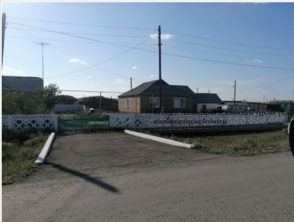
13 сурет. Алтынсария ауылындағы тұрғын үйлерде контейнерлердің болмауы