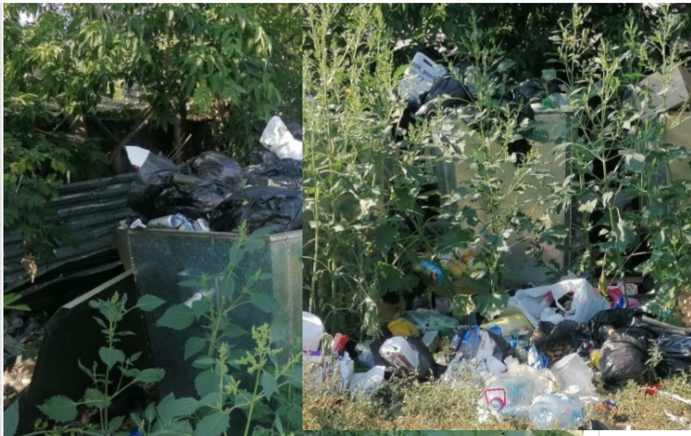
12 сурет. Қамысты ауыліндегі екі қабатты тұрғын үйдің жанында қоқысты қоймалау