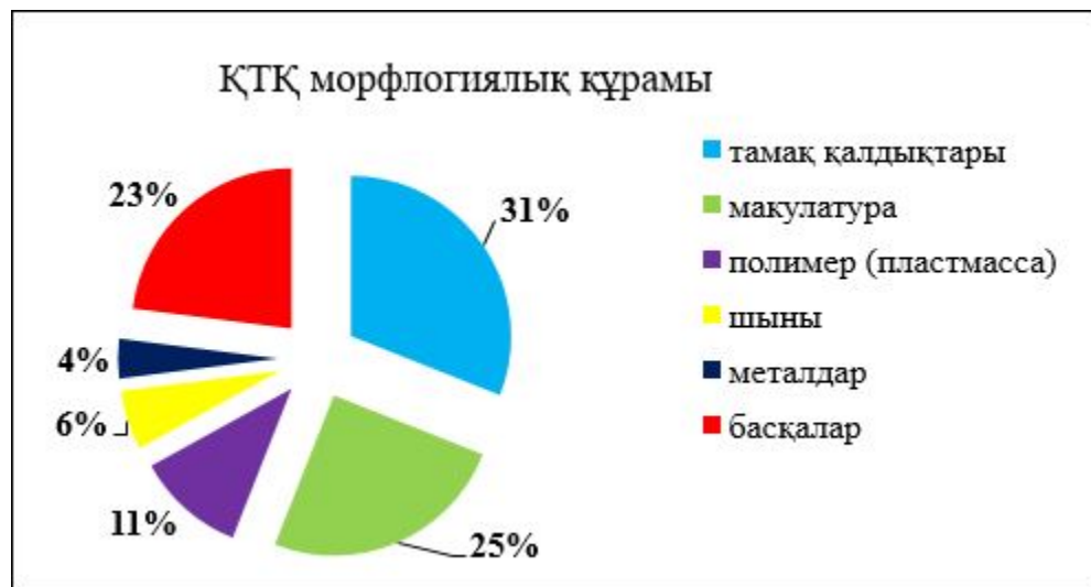
2 сурет. Халықтан пайда болатын коммуналдық қалдықтардың морфологиялық құрамы

Тұтыну қалдықтары немесе ҚТҚ күрделі қоспасы болып табылады және морфологиялық негізде ҚТҚ қазіргі уақытта келесі компоненттерден тұрады: қағаз, пластмасса, тамақ және өсімдік қалдықтары, әртүрлі металдар, шыны сынықтары, тоқыма бұйымдары, ағаш, былғары, резеңке, сүйектер. ҚТҚ-ның морфологиялық және фракциялық құрамының уақыт бойынша әртектілігі маусымдық ауытқуларға (күз айларында жемістер мен көкөністер қалдықтарының үлесінің артуы байқалады) және апталық өзгерістерге (жексенбі және дүйсенбіде пластик пакеттер мен қаптаманың басқа қалдықтарының үлесінің артуы байқалады) байланысты. 2-суретте Қазақстандағы ҚТҚ негізгі компоненттерінің мазмұны туралы әртүрлі дереккөздердің деректері жинақталған.