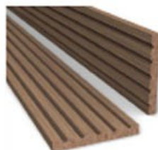
Торцевая планка 55*2200 мм