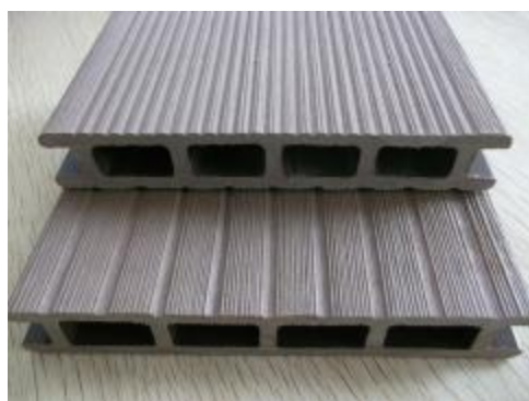
Ағаш-полимер композиттен жасалған қасбет панельдер кескіндерінің ҮЛГІЛЕРІ