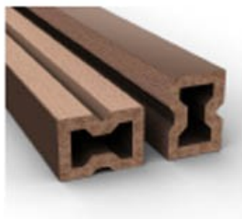
Лага 40*27*2200 мм