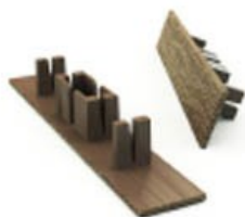
Заглушка к доске