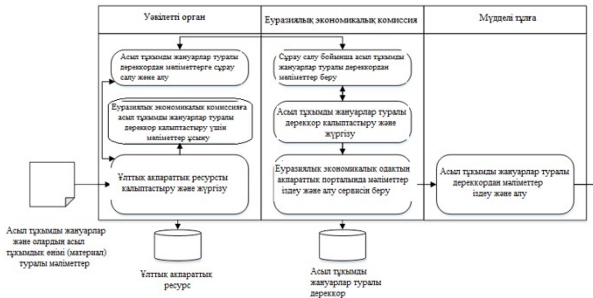
1-сурет. Асыл тұқымды жануарлар туралы дерекқорды қалыптастыру, жүргізу және пайдалану кезіндегі ақпараттық өзара іс-қимылдың функционалдық схемасы