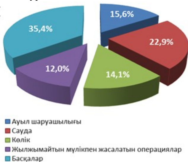
2-сурет – Көлеңкелі экономиканың 2012 жылғы салалық құрылымы

Шетелдік сарапшылардың зерттеулеріне сәйкес 2012 жылдың қорытындылары бойынша көлеңкелі экономиканың ең үлкен көлемі Шығыс Еуропа және Балтық елдерінде байқалады, атап айтқанда Болгарияда – 31,9 %, Румынияда – 29,1 %, Литвада – 28,5 % және Эстонияда – 28,2 %. Батыс Еуропаның Германия, Франция және Ұлыбритания сияқты елдерінде көлеңкелі экономика төмен, алайда олардың көрсеткіштері АҚШ-тан 7 %-ға және Жапониядан 8,8 %-ға төмен.