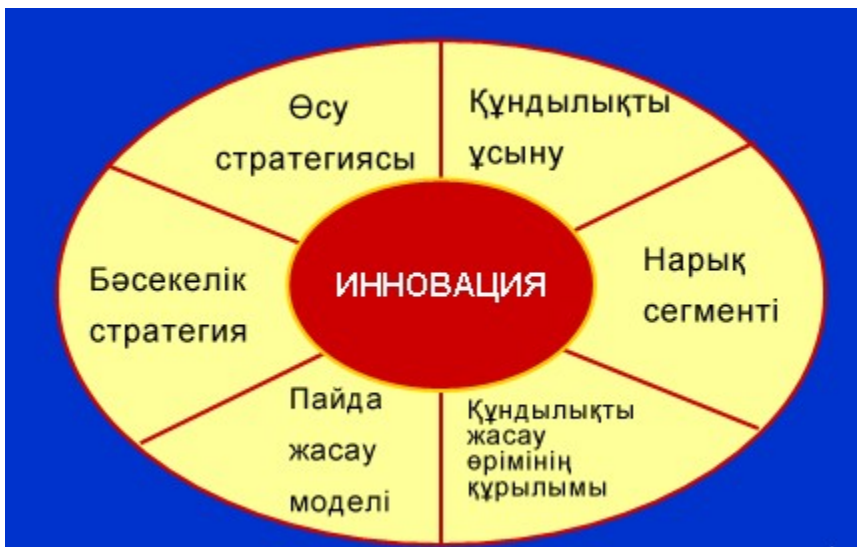
№ 2-схема. Компания құндылықтары

Сол арқылы, ӘКК Атырау облысындағы жобаларды іа кезінде мультипликативтік әсер жасай алады.