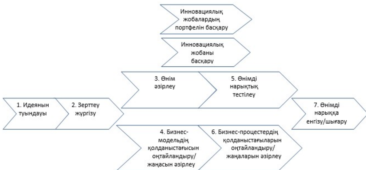
№ 3-схема. Бизнес-жобаларды қарау моделі

Сол арқылы, ӘКК Атырау облысындағы жобаларды іа кезінде мультипликативтік әсер жасай алады.