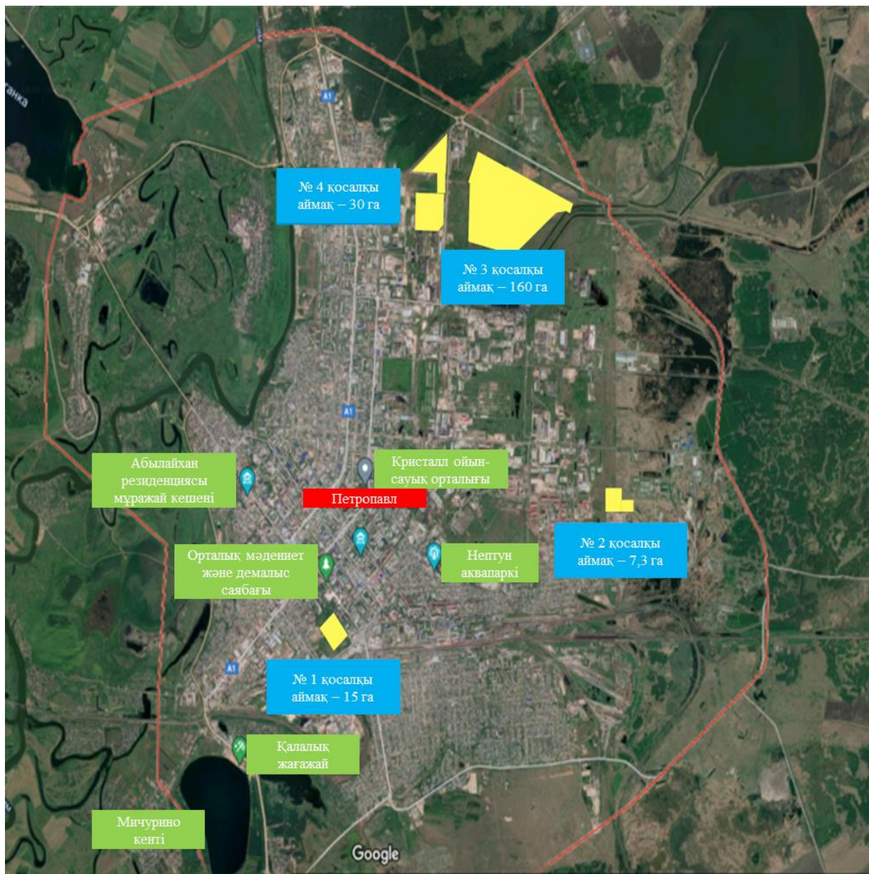
"Qyzyljar" АЭА-ның № 1 қосалқы аймағы Аумағы қаланың орталығында орналасқан, Парковая көшесі. Ауданы – 15 га.