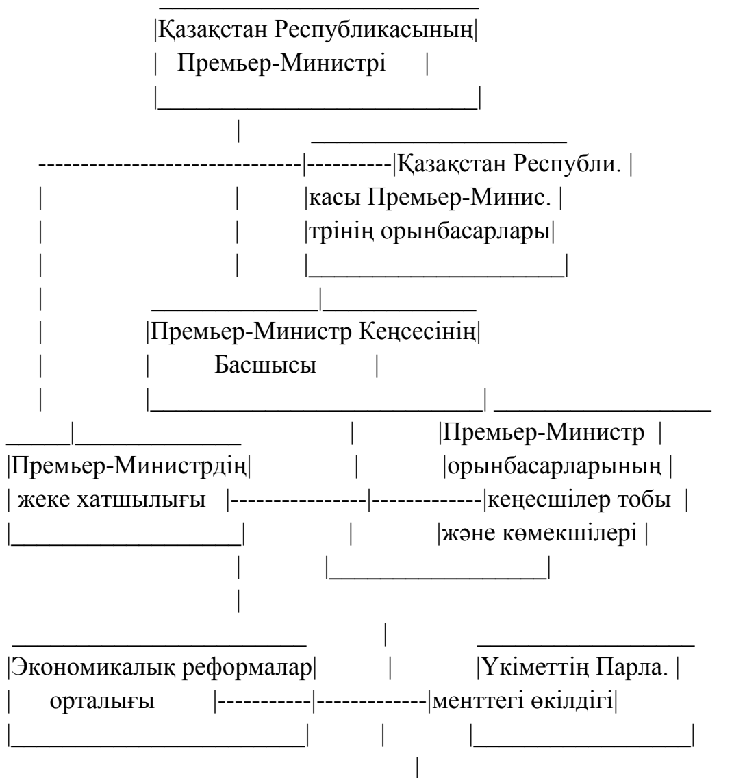
2-сурет. Премьер-Министр Кеңесінің құрылымы

Премьер-Министр кеңесінің жұмыс істеп тұрған құрылымының принциптік схемасы 2-суретте көрсетілген.