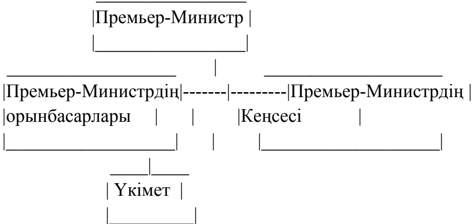
2-сурет. Орталық атқарушы органдардың қолданылып жүрген құрылымы Қосымша

Мемлекеттік аттеста. || Мәдениет министрлігі | циялық комитет || _____ | _____