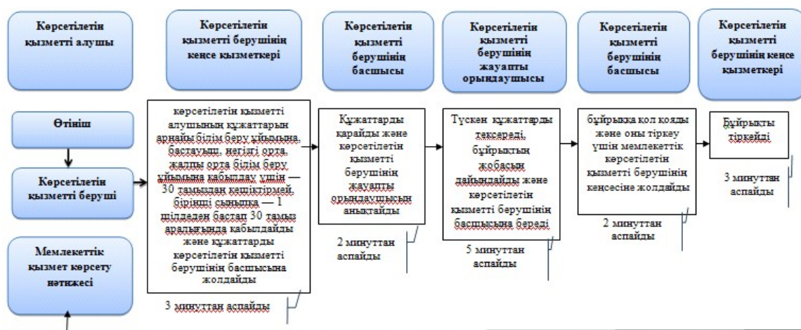
«Арнайы жалпы білім беретін оқу бағдарламалары бойынша оқыту үшін мүмкіндіктері шектеулі балалардың құжаттарын қабылдау және арнайы білім беру ұйымдарына қабылдау» мемлекеттік қызмет көрсетудің бизнес-процестерінің анықтамалығы

"Арнайы жалпы білім беретін оқу бағдарламалары бойынша оқыту үшін мүмкіндіктері шектеулі балалардың құжаттарын қабылдау және арнайы білім беру ұйымдарына қабылдау" мемлекеттік көрсетілетін қызмет регламентіне қосымша