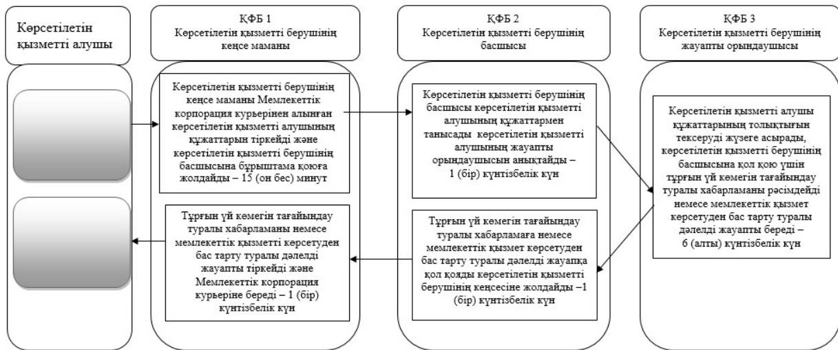
"Тұрғын үй көмегін тағайындау" мемлекеттік көрсетілетін қызмет регламентіне 2-қосымша