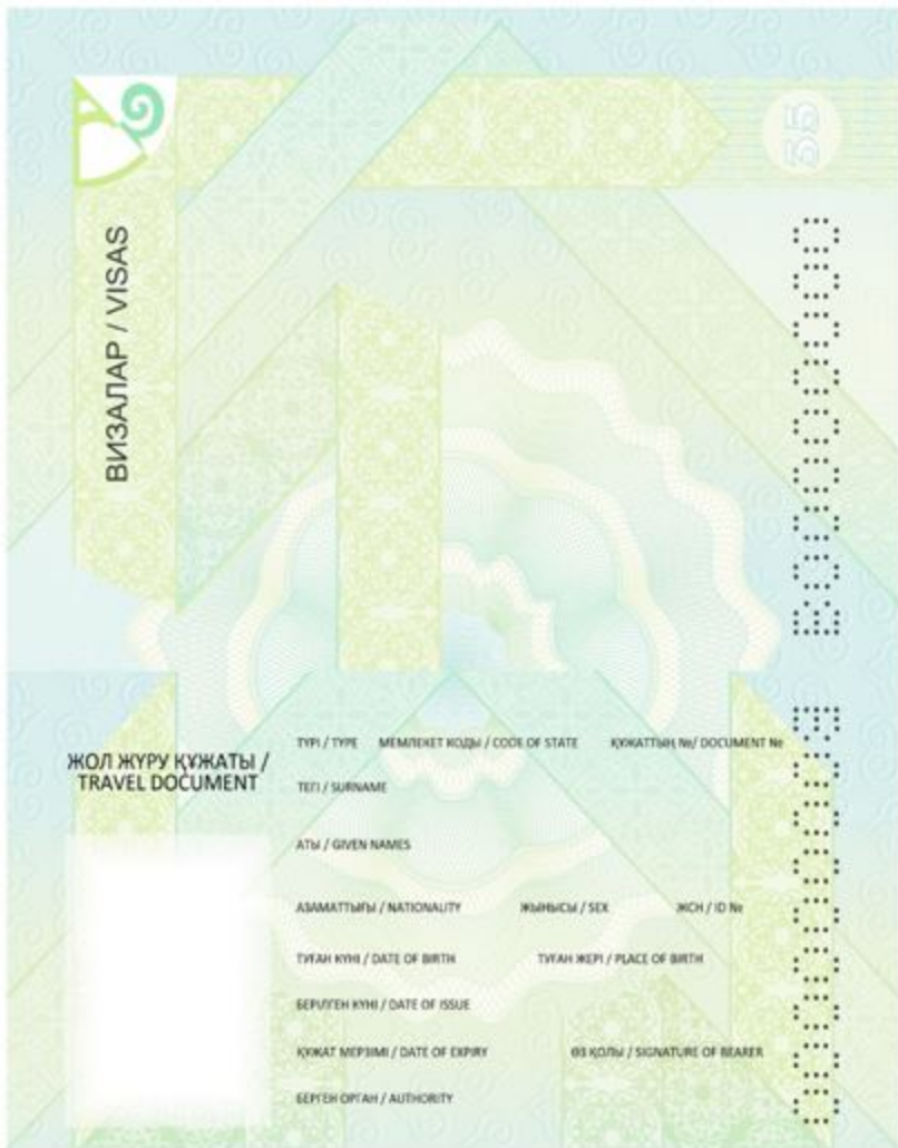
№ 5-сурет. 4-36-беттер