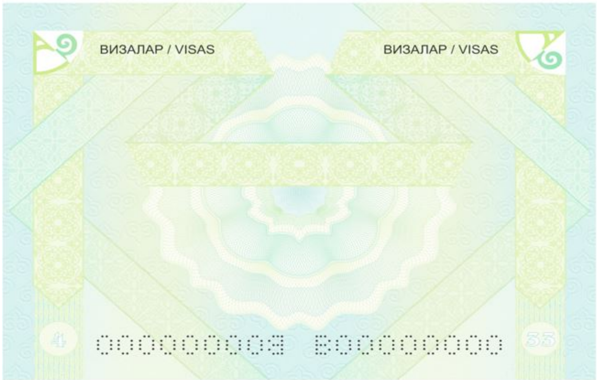
№ 6-сурет. Артқы форзац