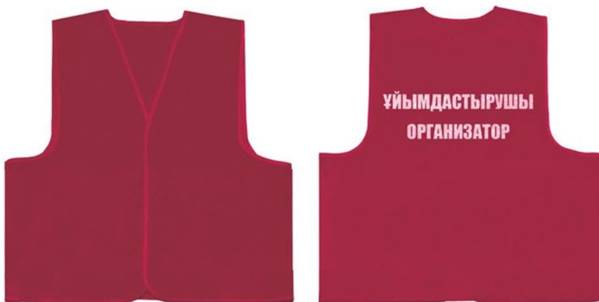
1 – сурет

3. Жапсырма бейбіт жиналыстарды ұйымдастырушының айырым белгісінің нысаны болып табылады.