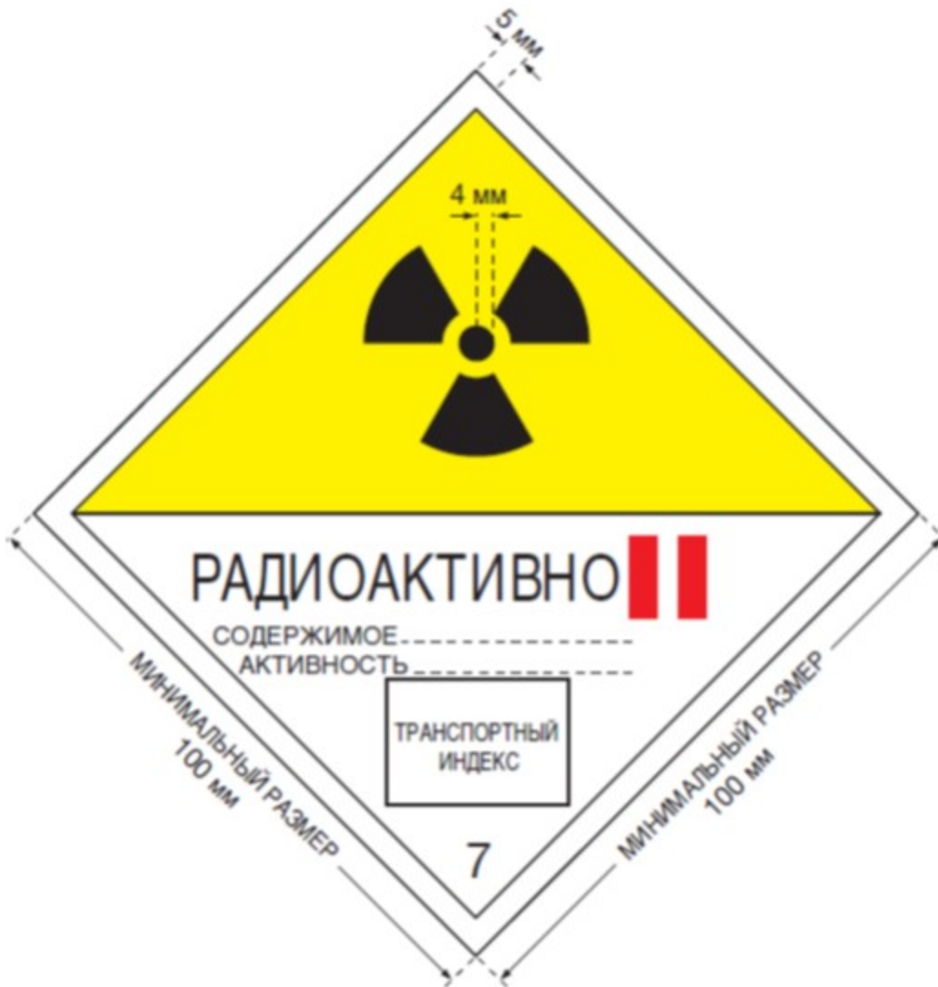
3-сурет. "П-САРЫ" санатының этикеткасы. Этикетканың жоғарғы жартысы фонының түсі - сары, төменгі жартысы - ақ, радиациялық қауіптіліктің негізгі белгісінің (үшқұлақтың) және жазбалардың түсі - қара, санатты белгілейтін жолақтың түсі - қызыл.