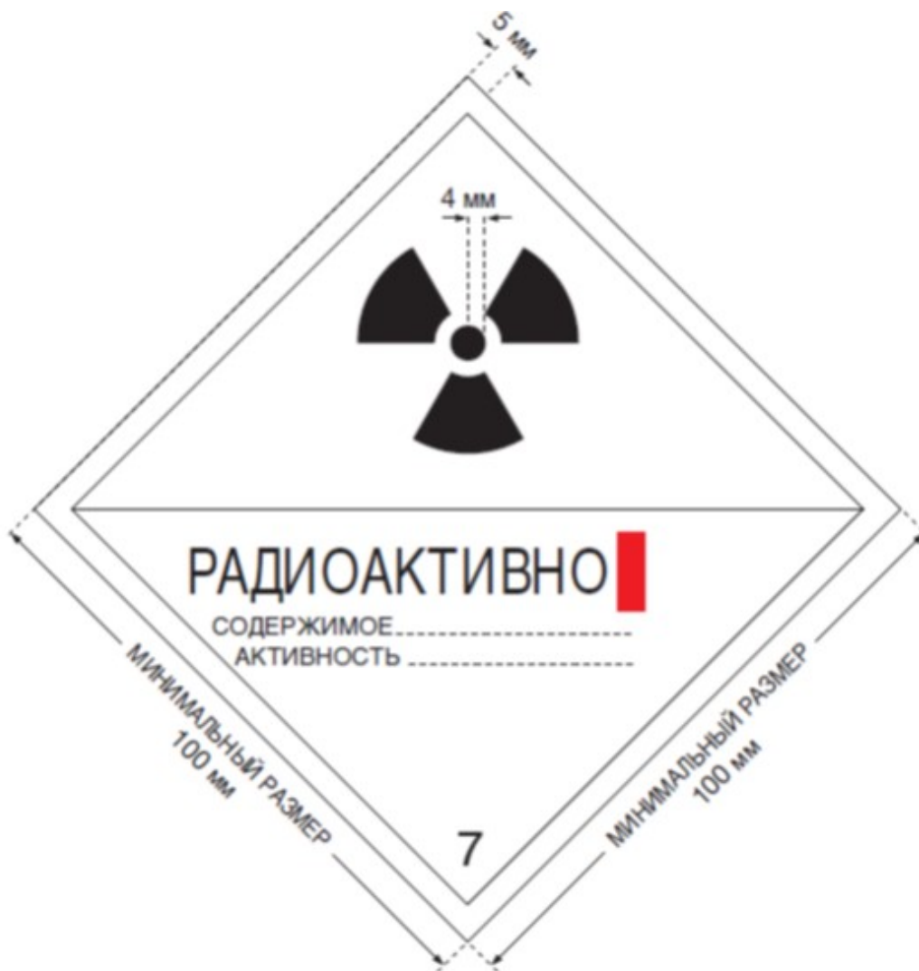
2-сурет. "I-AQ" санатының этикеткасы. Этикетка фонының түсі - ақ, радиациялық қауіптіліктің (үшқұлақтың) негізгі белгісінің және жазбалардың түсі - қара, санатты белгілейтін жолақтың түсі - қызыл.