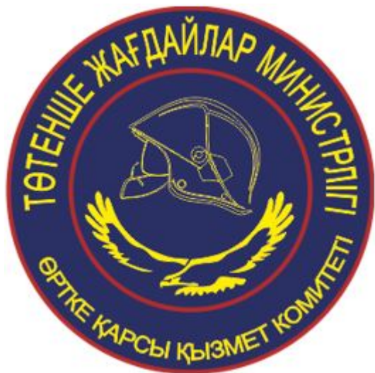
нарукавный знак для сотрудников Комитета противопожарной службы

Сноска. Параграф 2 - в редакции приказа и.о. Министра по чрезвычайным ситуациям РК от 20.10.2023 № 573 (вводится в действие по истечении десяти календарных дней после дня его первого официального опубликования).