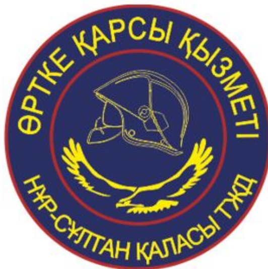
нарукавный знак для сотрудников территориальных подразделений