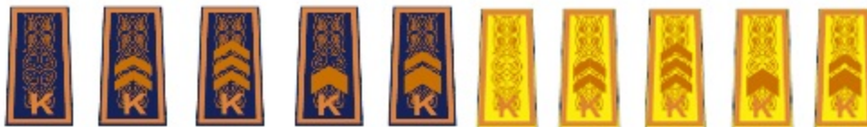
на зимние куртки и на специальное обмундирование