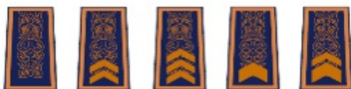
на зимние куртки и на специальное обмундирование