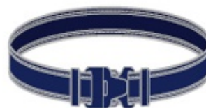
ремень к специальной форме