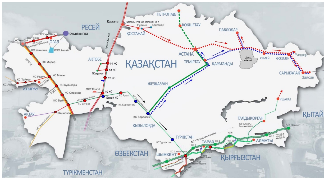
Приложение 7 к Генеральной схеме газификации Республики Казахстан на 2023 – 2030 годы