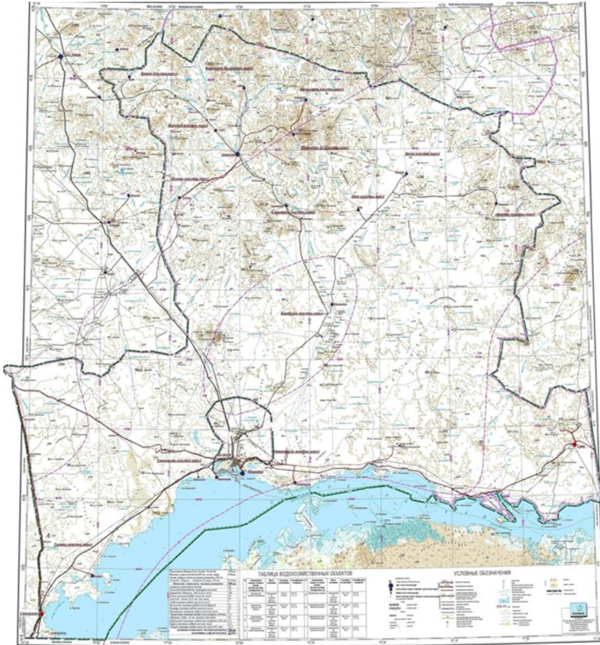
Схема доступа пастбищепользователей к водоисточникам (озерам, рекам, прудам, копаням, оросительным или обводнительным каналам, трубчатым или шахтным колодцам), составленная согласно норме потребления воды