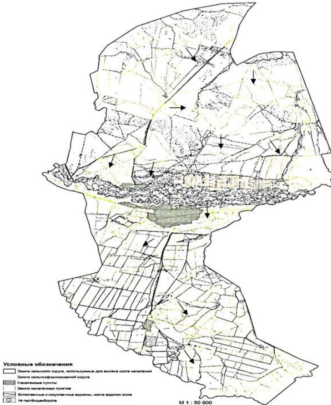
Приложение 7 к плану по управлению пастбищами и их использованию по Курчумскому сельскому округу на 2023-2024 годы