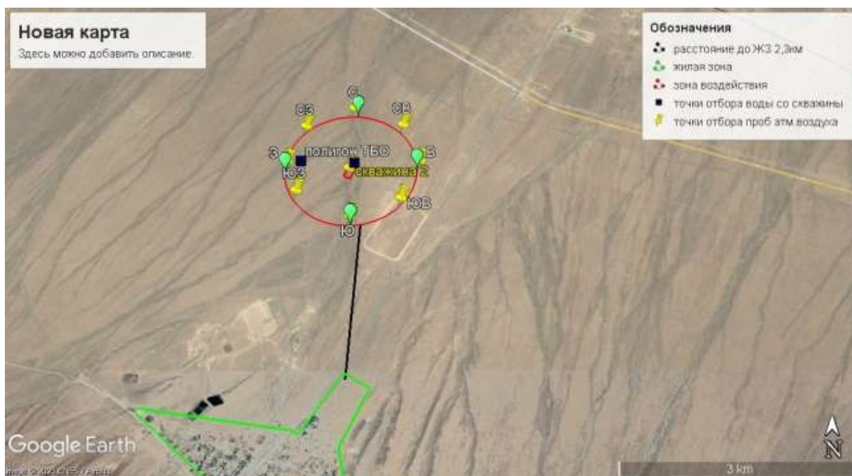
Рисунок 1.1. Ситуационная карта-схема расположения полигона ТОО "Аулиеколь-сервис"

Ближайшая зона расположена от источников на расстоянии: