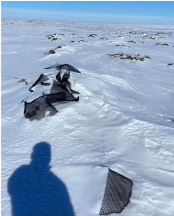
Рис. 1.17 – 1.19 Морфологический состав полигона Таскудук