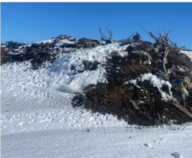
Рис. 1.10 – 1.13 Морфологический состав полигона

На территории сельского округа зарегистрировано 30 крестьянских хозяйств (КХ). В районе размещения полигона ТКО отсутствуют заповедники, памятники архитектуры, санитарно-профилактические учреждения, зоны отдыха и другие природоохранные объекты.