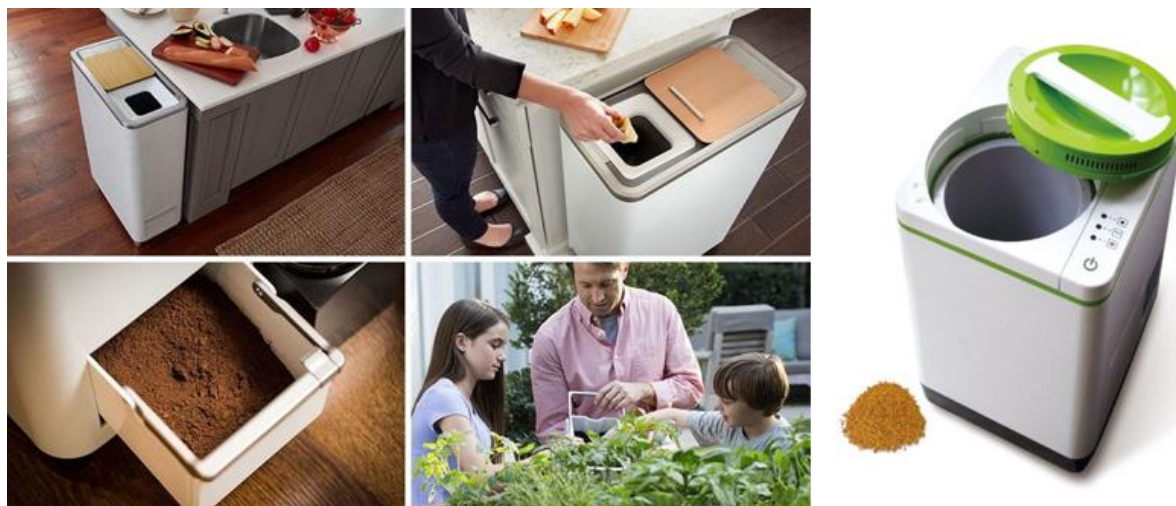
Рис.3.2 Метод компостирования в домашних условиях. Ведро для компостирования пищевых отходов

Наиболее часто встречающиеся варианты сортировки отходов предполагают разделение на опасные и не опасные отходы. Опасные отходы должны собираться отдельно и доставляться на специальные пункты сбора, откуда их направляют на переработку в специализированные компании. Частные лица, как правило, осуществляют доставку опасных отходов на пункты сбора самостоятельно.