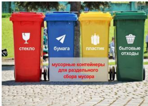
Рис. 3.6 Контейнеры для раздельного сбора устанавливаемые в общественных местах