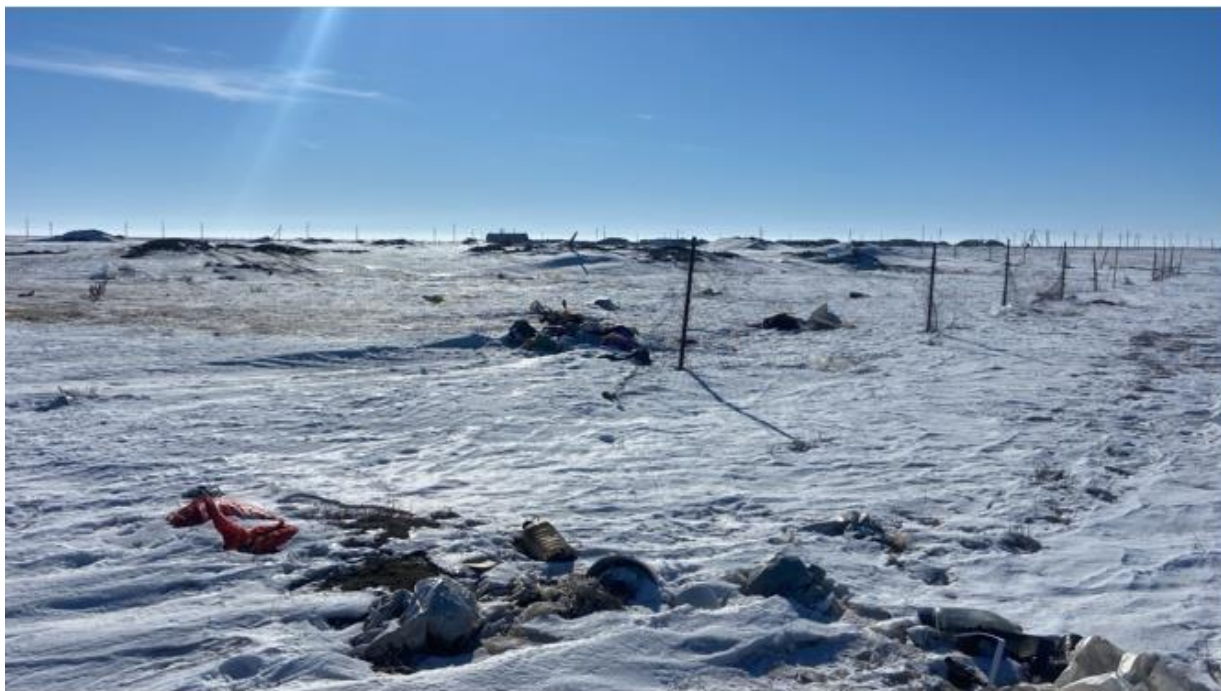
Рис. 1.25 – 1.26 Морфологический состав полигона Косарал

На территории сельского округа зарегистрировано 33 крестьянских хозяйств (КХ). В районе размещения полигона ТКО отсутствуют заповедники, памятники