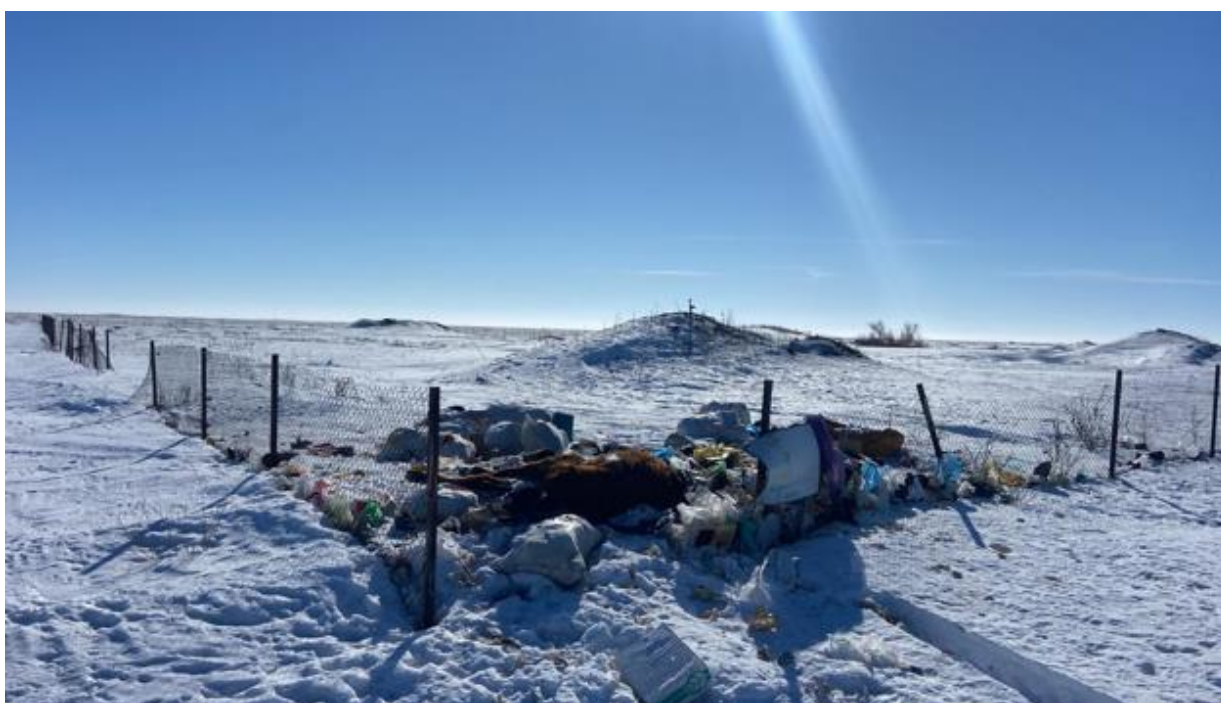
Рис. 1.31 – 1.32 Морфологический состав полигона Булан

На территории сельского округа зарегистрировано 13 КХ. В районе размещения полигонов ТКО отсутствуют заповедники, памятники архитектуры, санитарно-профилактические учреждения, зоны отдыха и другие природоохранные объекты.