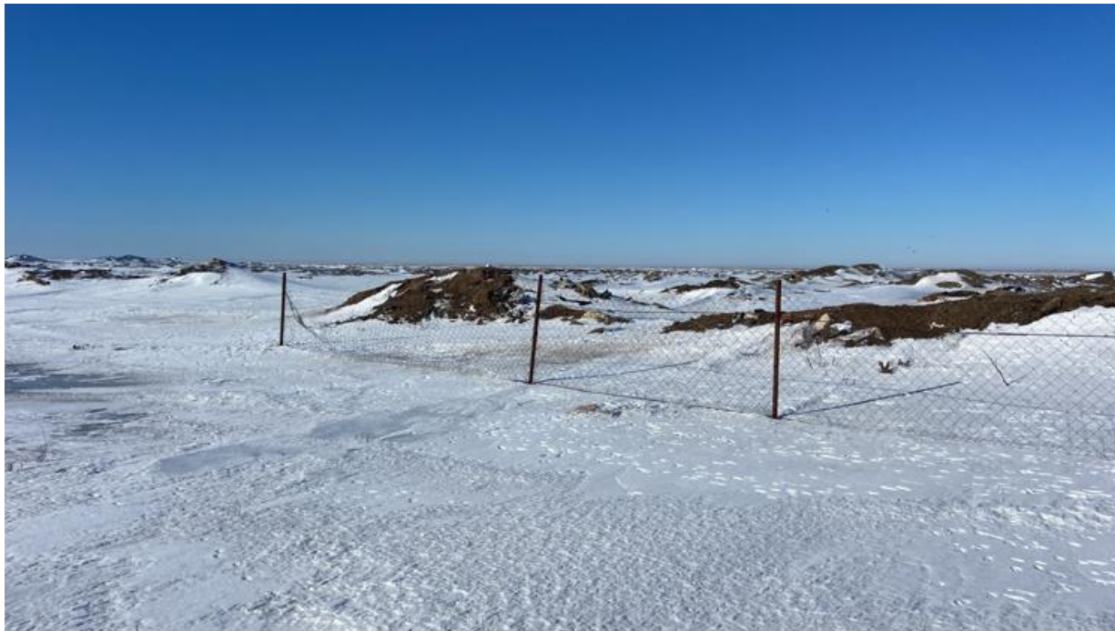
Рис. 1.6 – 1.8 Морфологический состав полигона

На территории сельского округа зарегистрировано 15 крестьянских хозяйств (КХ). В районе размещения полигона ТБО отсутствуют заповедники, памятники архитектуры, санитарно-профилактические учреждения, зоны отдыха и другие природоохранные объекты.