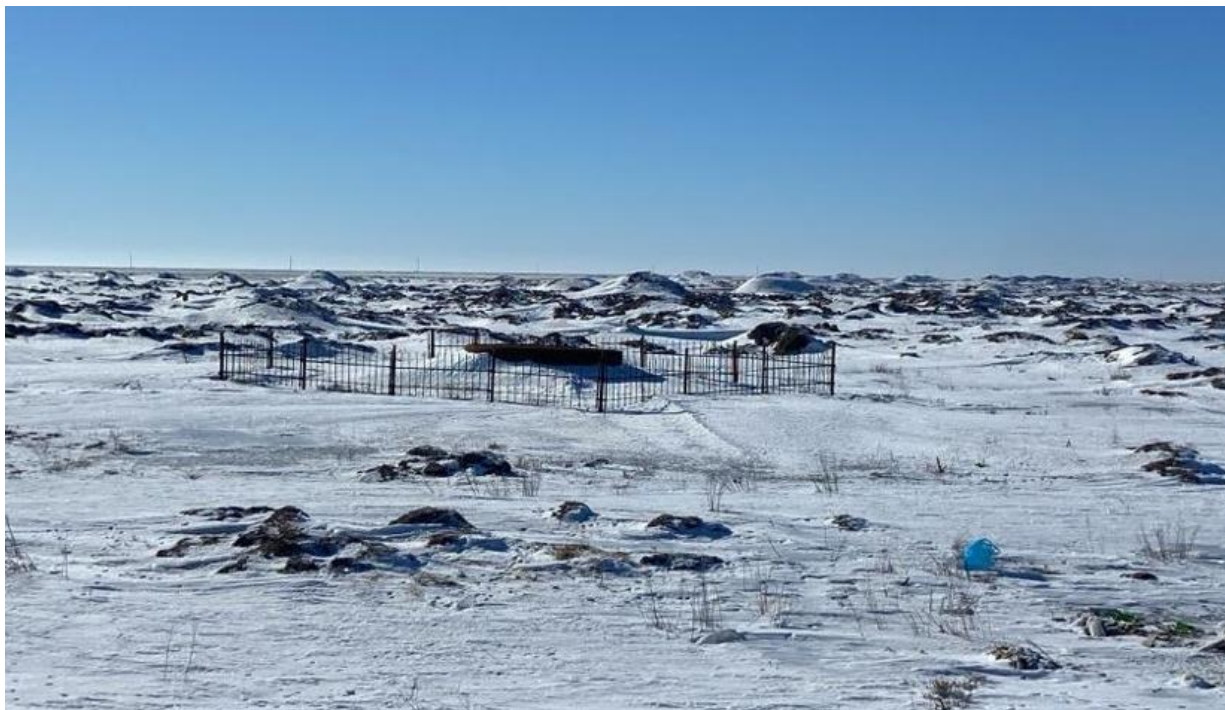
Рис. 1.9 Биотермическая яма Кособа