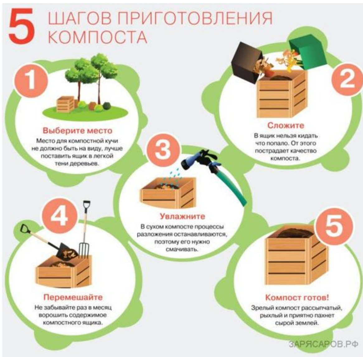
Рис. 3.4 Пошаговая инструкция приготовления компоста в домашних условиях для удобрения растений

Шаг 2. Внедрение залоговой стоимости упаковки и стеклотары с целью организации эффективной системы сбора упаковки и стеклотары для обеспечения ее дальнейшего использования или переработки производителем либо импортером. Организация эффективной системы сбора упаковки и стеклотары для обеспечения ее дальнейшего использования или переработки производителем либо импортером.