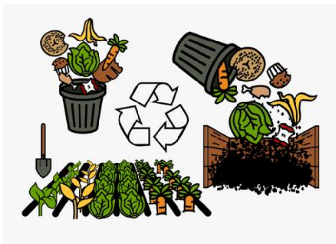
Рис. 3.3 Система управления биологически разлагаемых (пищевых и зеленых) коммунальных отходов

Шаг 1. В сельской местности работа с населением о необходимости отдельного складирования биологически разлагаемых (пищевых и зеленых) коммунальных отходов "у источника" путем установки отдельного, промаркированного контейнера для сбора таких отходов. Вовлечение заинтересованных предпринимателей в переработке и или вторичном использовании таких отходов в виде компоста как удобрение или пищи для живности. В частности это – крестьянские хозяйства.