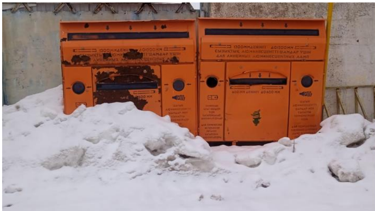
Рис. 1.1 – 1.5 Морфологический состав полигона Жымпиты

На территории сельского округа зарегистрировано 56 крестьянских хозяйств (КХ). В районе размещения полигона ТКО отсутствуют заповедники, памятники архитектуры, санитарно-профилактические учреждения, зоны отдыха и другие природоохранные объекты.