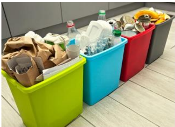
Рис. 3.5 Контейнеры раздельного сбора в домашних условиях

вторичное сырье будет размещаться в одном контейнере. Для этого следует использовать контейнеры объемом не менее 1,1 м куб. м, окрашенные и промаркированные для их легкой идентификации населением.