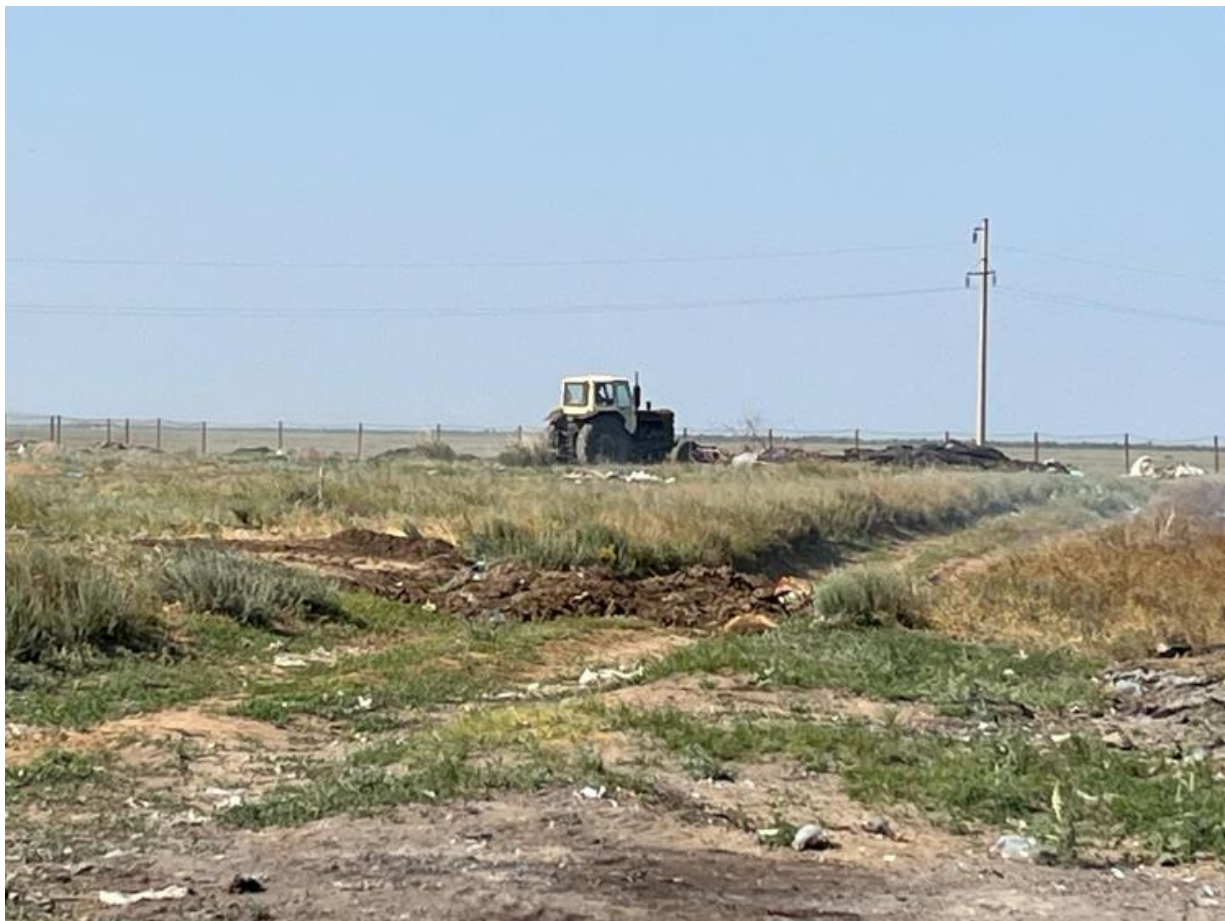
Рис. 1.33 – 1.35 Морфологический состав полигона Булдырты

На территории сельского округа зарегистрировано 76 КХ. В районе размещения полигонов ТКО отсутствуют заповедники, памятники архитектуры, санитарно-профилактические учреждения, зоны отдыха и другие природоохранные объекты.