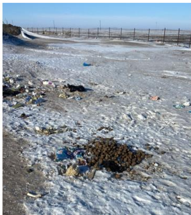
Рис. 1.27 – 1.30 Морфологический состав полигона ТКО Шагьрлыой

На территории сельского округа зарегистрировано 26 КХ. В районе размещения полигонов ТКО отсутствуют заповедники, памятники архитектуры, санитарно-профилактические учреждения, зоны отдыха и другие природоохранные объекты.