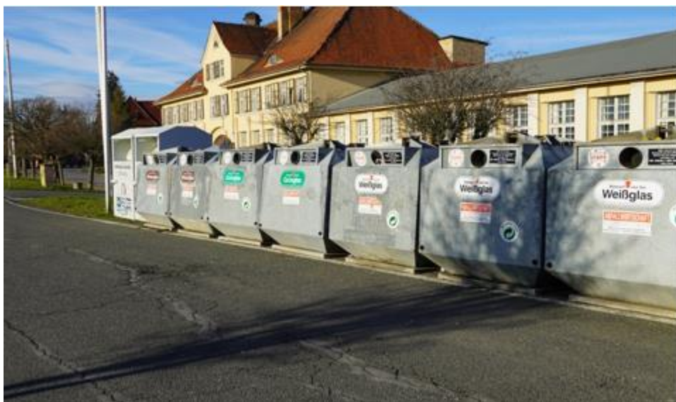
Рис. 3.1 Раздельный сбор мусора в Германии

Как видно из иерархии, использование отходов для производства изделий, материалов или веществ имеет больший приоритет перед использованием отходов для производства энергии или топлива. Независимо от вида компании, осуществляющей сбор, транспортировку и переработку, практически все схемы обращения с отходами в странах ЕС предполагают первичную сортировку отходов непосредственно в местах их образования (в домашних хозяйствах, на производстве, в офисных помещениях и т.д.). В странах ЕС до 2015 года получилось внедрить отдельный сбор как минимум в отношении бумаги, пластмассы, стекла и металла.