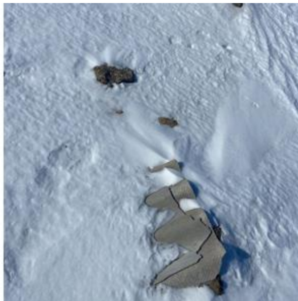
Рис. 1.20 – 1.22 Морфологический состав полигона ТКО Талдыбулак

На территории сельского округа зарегистрировано 14 крестьянских хозяйств (КХ). В районе размещения полигонов ТКО отсутствуют заповедники, памятники архитектуры, санитарно-профилактические учреждения, зоны отдыха и другие природоохранные объекты.