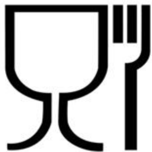
Рис. 1. Упаковка (укупорочные средства), предназначенная для контакта с пищевой продукцией

Символ, обозначающий, что упаковка предназначена для контакта с пищевой продукцией, допускается наносить как без рамки, так и в рамке (круглой, квадратной и др.).