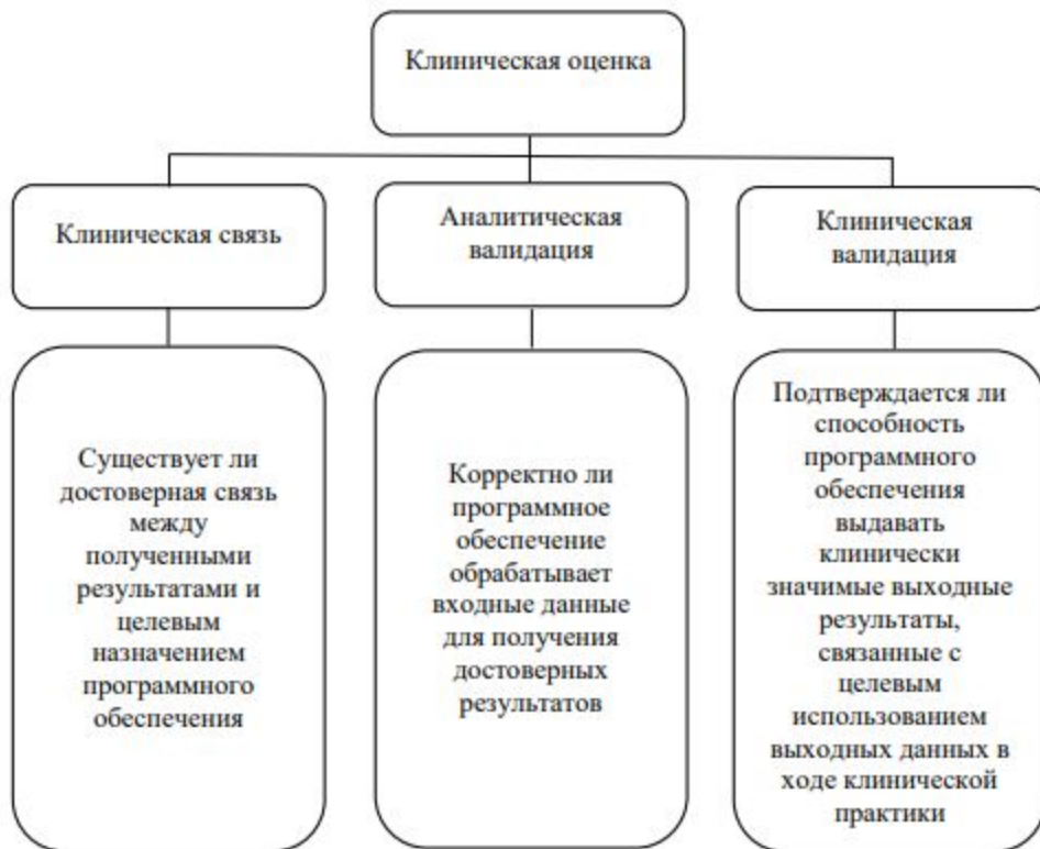
Рис. 1. Блок-схема проведения клинической оценки.

16. В ходе проведения клинической оценки определяется клиническая связь ( научная обоснованность) подбора данных и системы их анализа (концепция, измерения , заключение) с целевым назначением программного обеспечения.