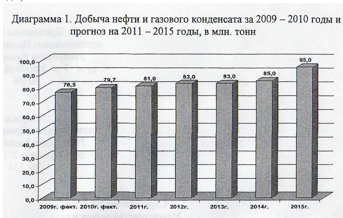
Диаграмма 1. Добыча нефти и газового конденсата за 2009 – 2010 годы и прогноз на 2011 – 2015 годы, в млн. тонн

В 2015 году ожидается рост объема добычи нефти и газового конденсата до 112,9 % по отношению к 2010 году (прирост добычи составит 10,3 млн. тонн), что отражено в диаграмме 1: