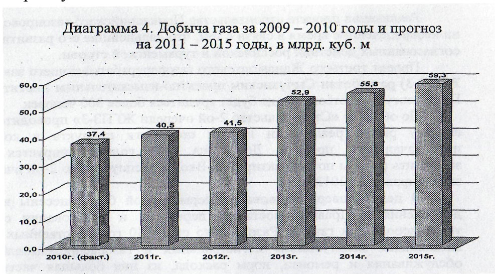
Диаграмма 4. Добыча газа за 2009 – 2010 годы и прогноз на 2011 – 2015 годы, в млрд. куб. м

Увеличение добычи газа обеспечивается путем развития новых и основных базовых месторождений углеводородов, таких как Карачаганак, Тенгиз, Жанажол, Толкын и ряда других месторождений, принадлежащих акционерному обществу «Национальная компания «КазМунайГаз» (далее – КМГ), а также месторождений Каспийского шельфа ( К а ш а г а н и д р у г и е ) .