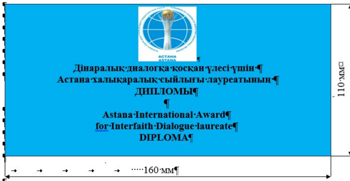
Приложение 3 к описанию диплома и памятного знака лауреата Астанинской международной премии за вклад в межрелигиозный диалог