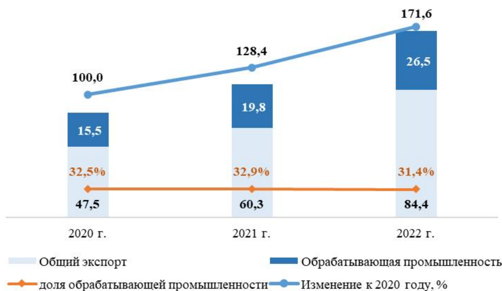
рисунок 3. Динамика экспорта товаров Республики Казахстан, млрд долларов США

Общий объем экспорта товаров и услуг из Казахстана по итогам 12 месяцев 2022 года составил 84,4 млрд долларов США, что на 36,9 млрд долларов США больше показателя 2020 года.