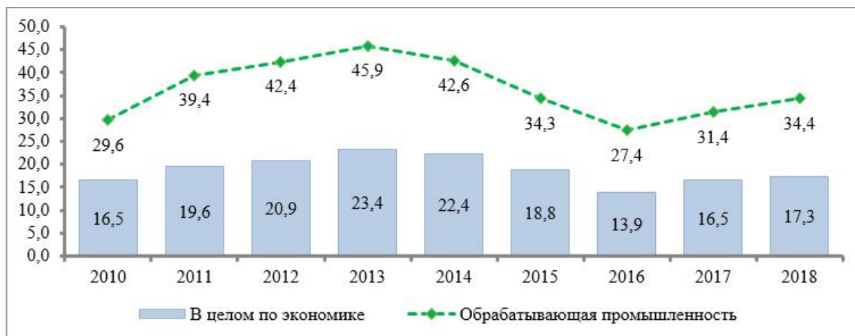
Рисунок 4. Производительность труда в целом по экономике, промышленности и отраслям промышленности Республики Казахстан в 2010 – 2018 годы, тыс. долларов США/чел.