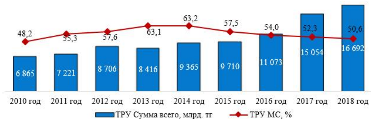
Рисунок 7. Динамика показателей регулируемых закупок и местного содержания в них за 2010-2018 годы

Анализ регулируемых закупок товаров, работ и услуг (государственные закупки, закупки национальных компании и холдингов, закупки недропользователей – закупки субъектов мониторинга) показал, что по республике с 2010 по 2018 годы при общем росте объемов закупок в 2,4 раза в целом, произошел рост доли местного содержания с 48,2% до 50,6%. При этом наибольший показатель местного содержания приходится на 2014 год (доля местного содержания – 63,2%) с резким снижением в 2015 году на 5,7% и дальнейшим ежегодным понижением.