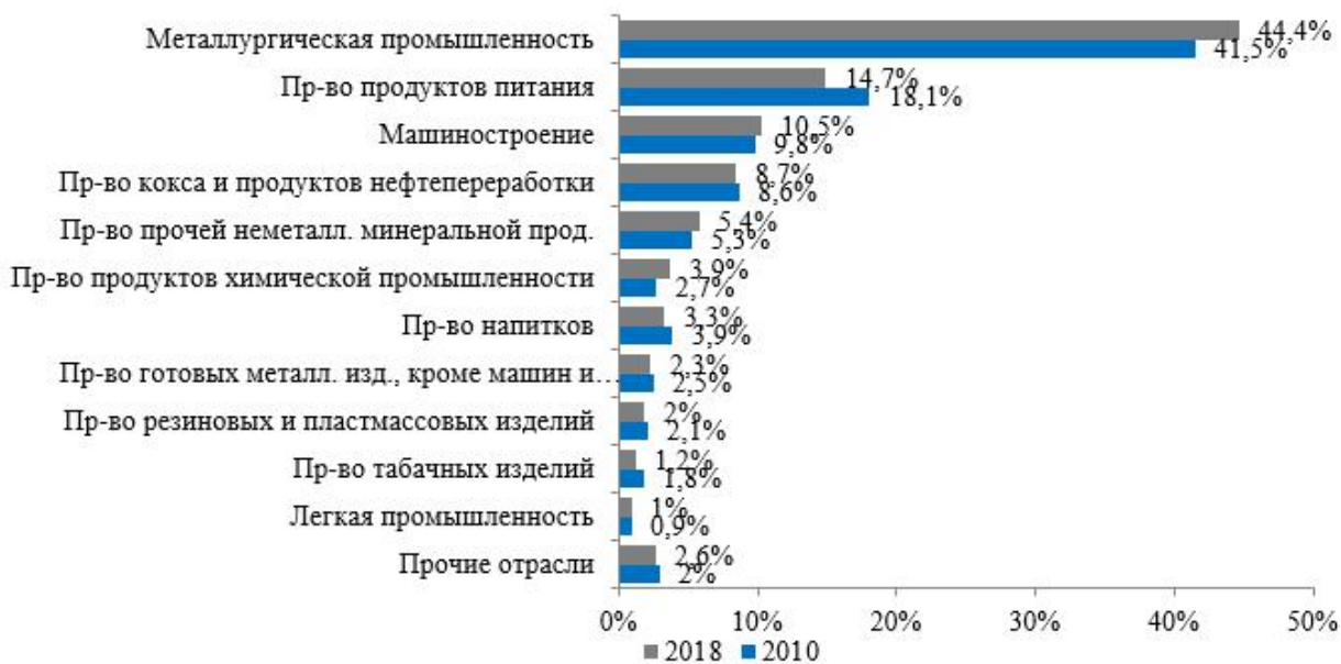
Рисунок 1. Отраслевая структура отраслей обрабатывающей промышленности в 2010 и 2018 годах, в % к итогу (100% - вся обрабатывающая промышленность)

В структуре выпуска обрабатывающей промышленности за 2018 год продолжает превалировать металлургия (44,4 %), в 2010 году – 41,5 %, наблюдается некоторое снижение доли производства продуктов питания (с 18,1 % до 14,7 %), незначительно увеличилась доля машиностроения (с 9,8% до 10,5%), химической промышленности (2,7 % до 3,9 %). Удельный вес остальных отраслей практически не претерпел изменений (рисунок 1).