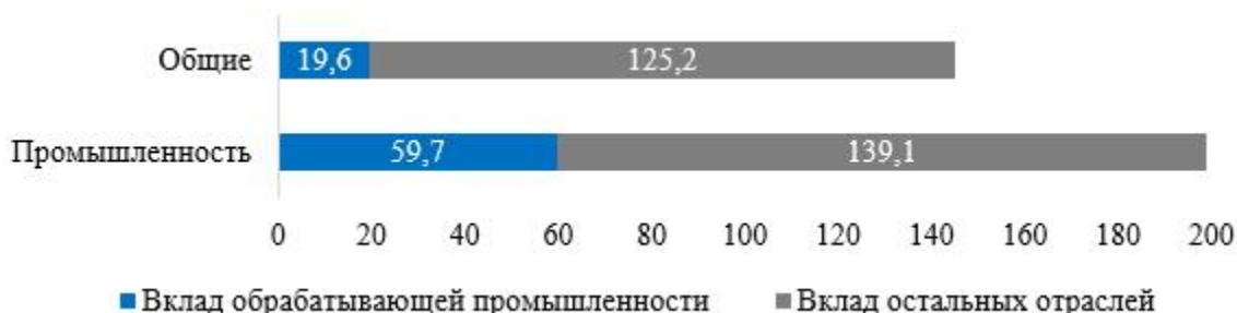
Рисунок 6. Декомпозиция накопленных темпов роста инвестиций в основной капитал по всей экономике и промышленности за 2010-2018 годы, в %

Приток инвестиций в основной капитал обрабатывающей отрасли в разрезе всей экономики и промышленности сопоставим со вкладом обрабатывающей промышленности в валовый внутренний продукт страны и промышленности, в целом, за анализируемый период. Так, за анализируемый период инвестиции в основной капитал (в текущих ценах) по всей экономике и промышленности кумулятивно выросли на 144,8 % и 198,8 %, соответственно. Из них 19,6 п.п. и 59,7 п.п. приходятся на обрабатывающую промышленность.