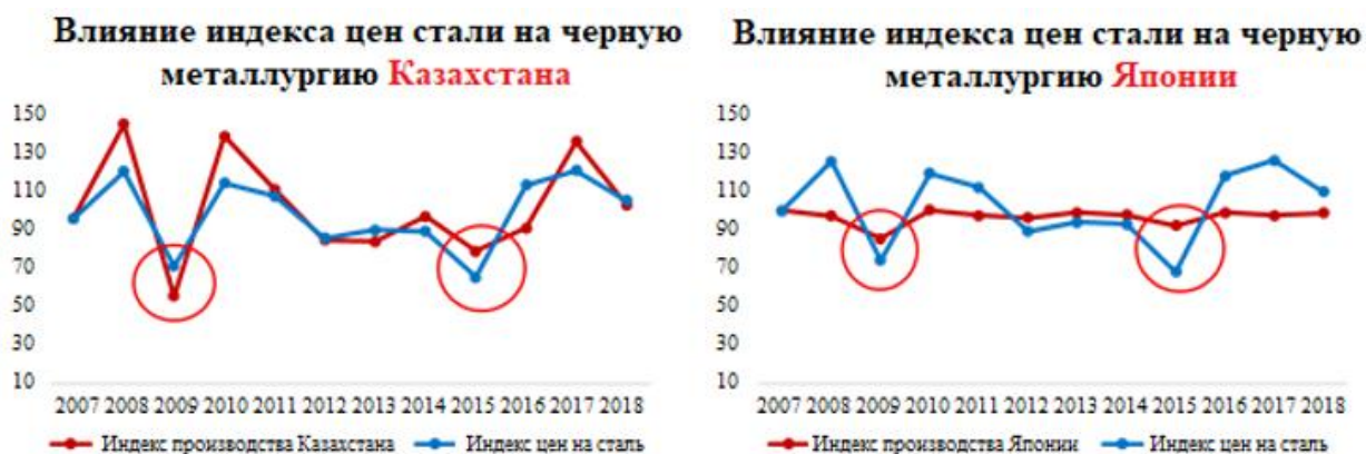
Рисунок 2. Сравнение влияния индекса цен стали на черную металлургию в Казахстане и Японии.