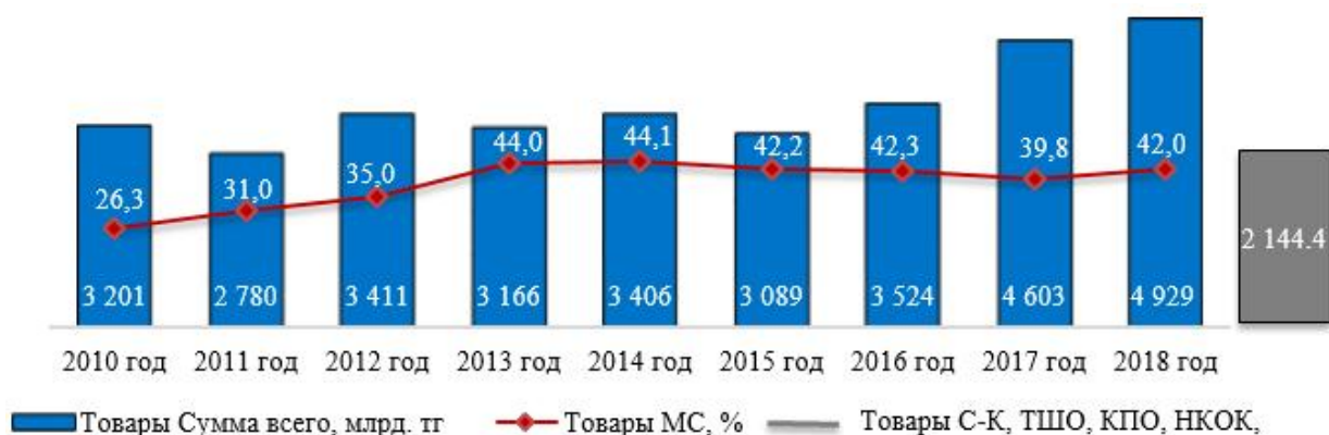
Рисунок 8. Динамика показателей регулируемых закупок товаров и местного содержания в них за 2010-2018 годы

Достойны отдельного внимания группа компаний: акционерное общество "Фонд национального благосостояния "Самрук-Казына" и Тенгизшевройл, Карачаганак Петролиум Оперейтинг, Северо-Каспийская операционная компания. По итогам 2018 года сумма их закупок составила 9,6 трлн. тенге (56,9 % от общего объема), из них товаров на 2,1 трлн. тенге (43,5% от всех товаров). Доля местного содержания в них составила 60,7% в целом, а у крупных операторов доля местного содержания не превышает 7,3%.