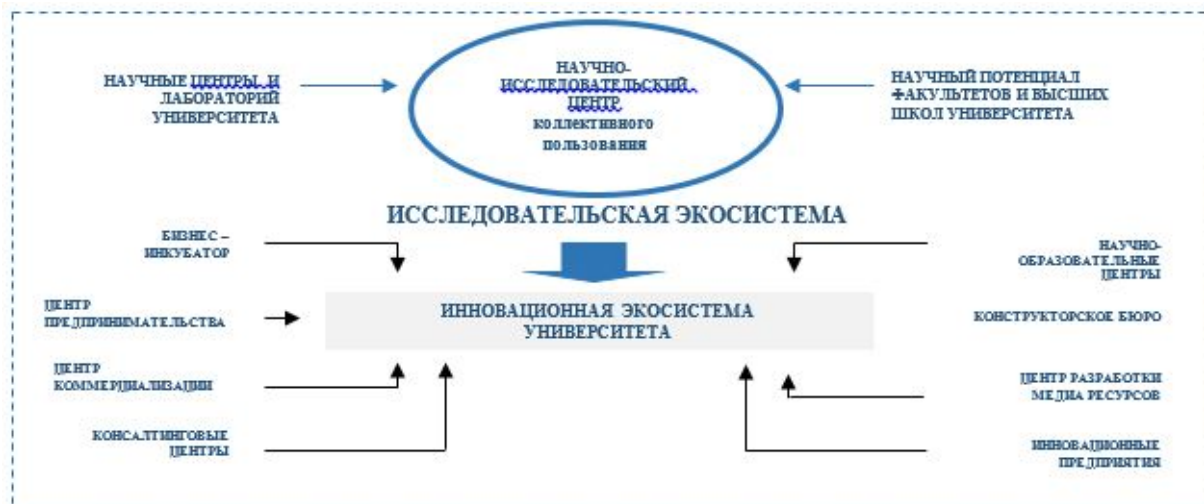
Рисунок 4. Единая инновационная экосистема

Созданная исследовательская экосистема будет интегрирована с существующей исследовательской и инновационной экосистемой университета. В ходе интеграции будет модернизирована и реорганизована существующая и создана единая инновационная исследовательская экосистема, которая составит основу исследовательского университета.