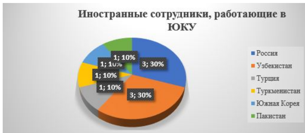
Рисунок 1- Иностранные сотрудники, работающие в ЮКУ (2021 – 2023 гг.)

Для организации занятий в трехязычных или англоязычных группах привлекаются преподаватели, имеющие международные сертификаты, подтверждающие владение иностранным языком в соответствии с общеевропейскими компетенциями владения иностранным языком (IELTS (АЙЛТС); TOEFL IBT (ТОЭФЛ АЙБИТИ); TOEFL ITP (ТОЭФЛ АЙТИПИ)). Ежегодно Центром дополнительного образования организуется и проводится 72-х часовой курс по технологии CLIL (КЛИЛ) для ППС и слушателей университета.