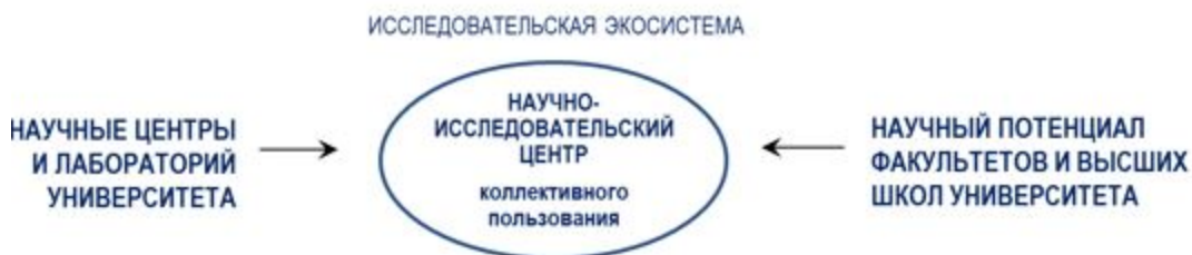
Рисунок 3 - Исследовательская экосистема

Согласно идее Программы основным ядром создаваемой в ЮКУ инновационной исследовательской экосистемы (рисунок 3) будет научно-исследовательский центр коллективного пользования.