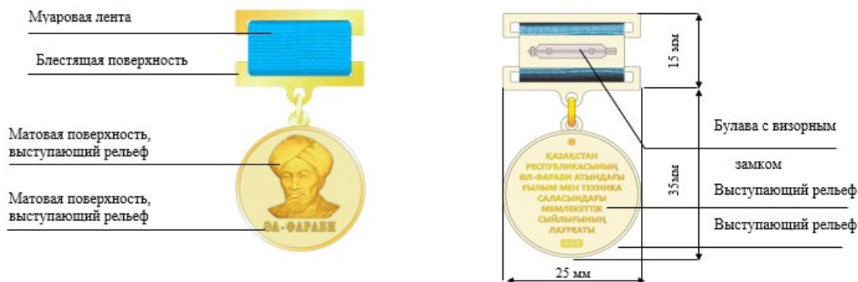
ПРИЛОЖЕНИЕ 6 к описанию диплома и нагрудного знака лауреата Государственной премии Республики Казахстан