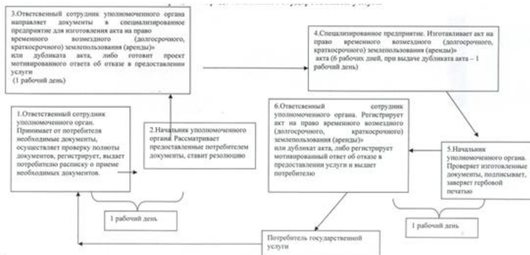
Схема процесса предоставления государственной услуги

У т в е р ж д е н п о с т а н о в л е н и е м а к и м а т а г о р о д а Э к и б а с т у з а о т 7 д е к а б р я 2011 г о д а N 1199/11