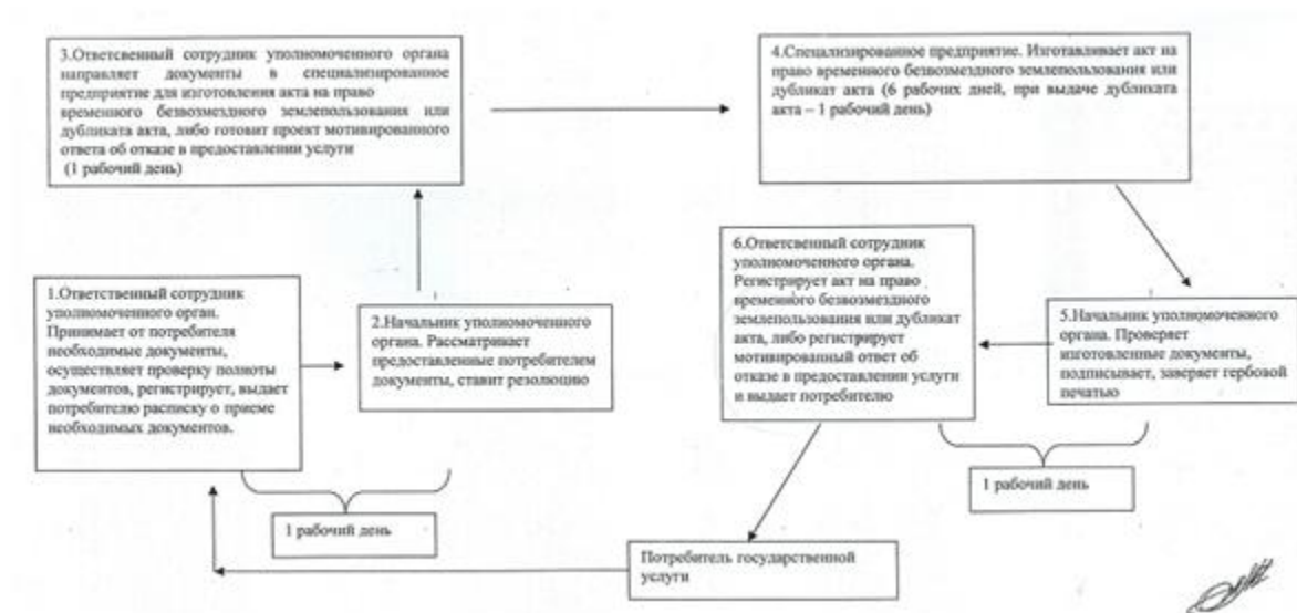
Схема процесса предоставления государственной услуги