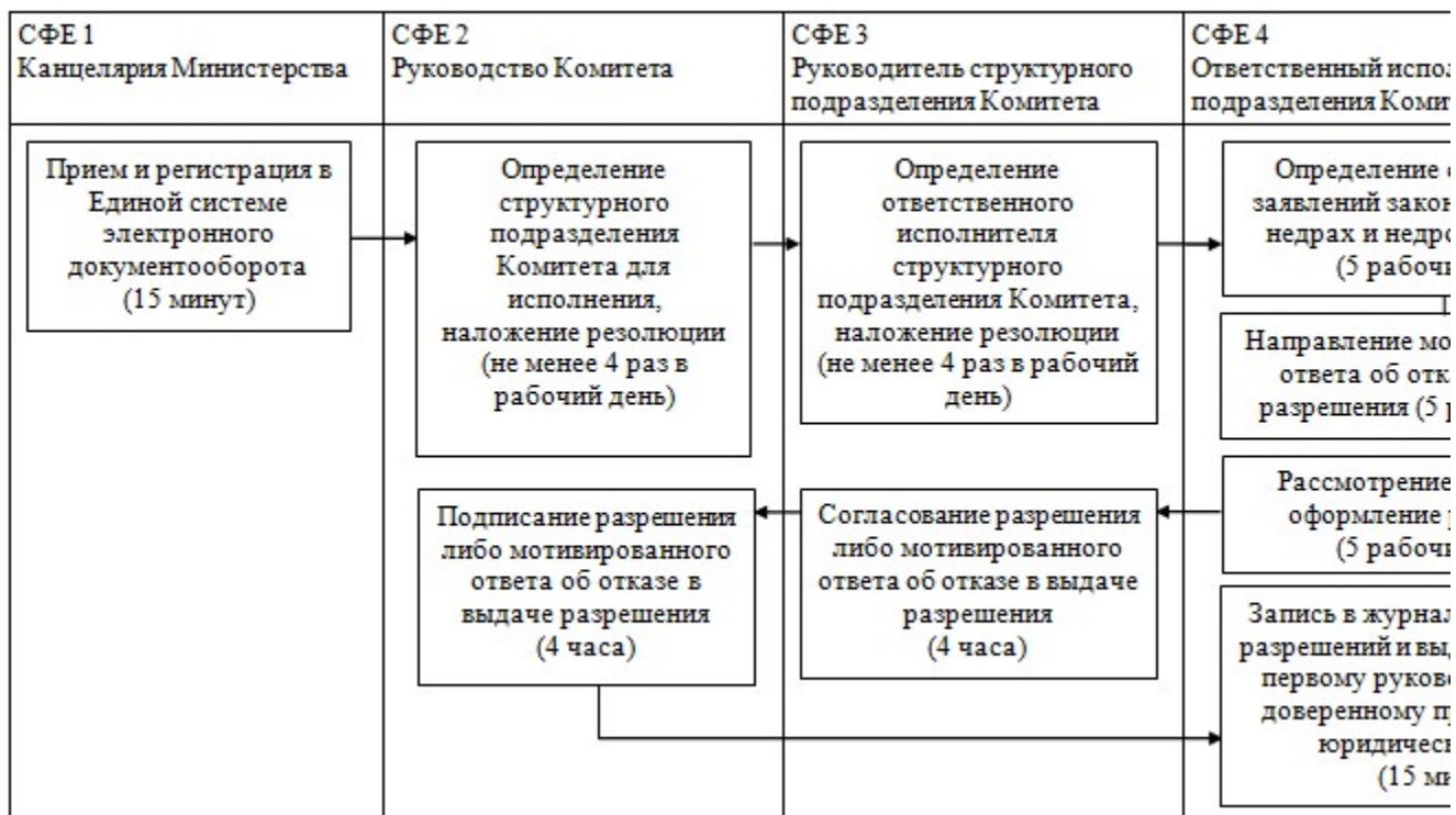
Диаграмма функционального взаимодействия