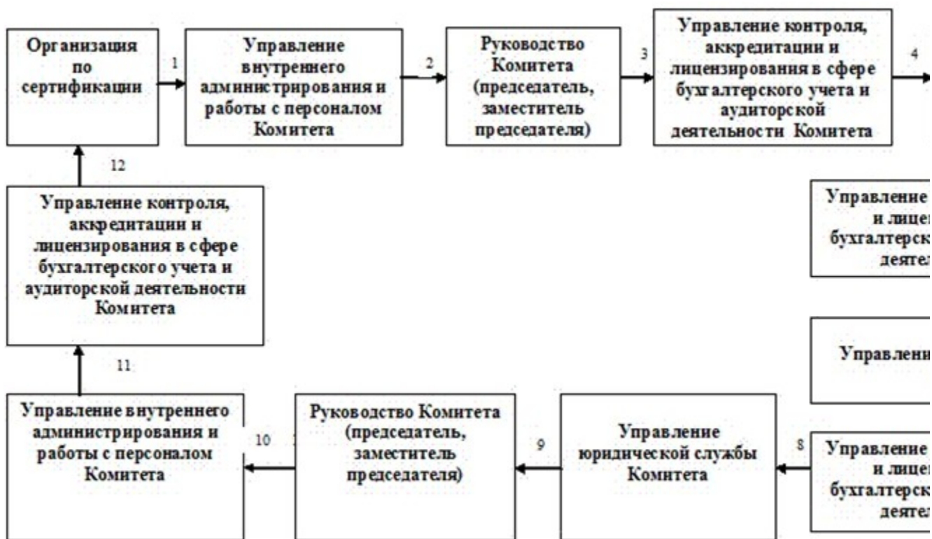
Схема включения в реестр таможенных представителей