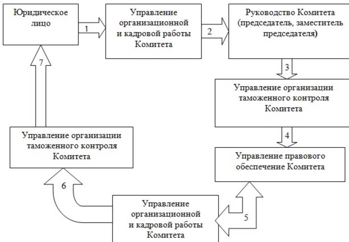
Схема присвоение статуса УЭО юридическому лицу

к Регламенту государственной услуги «Присвоение статуса уполномоченного экономического оператора»