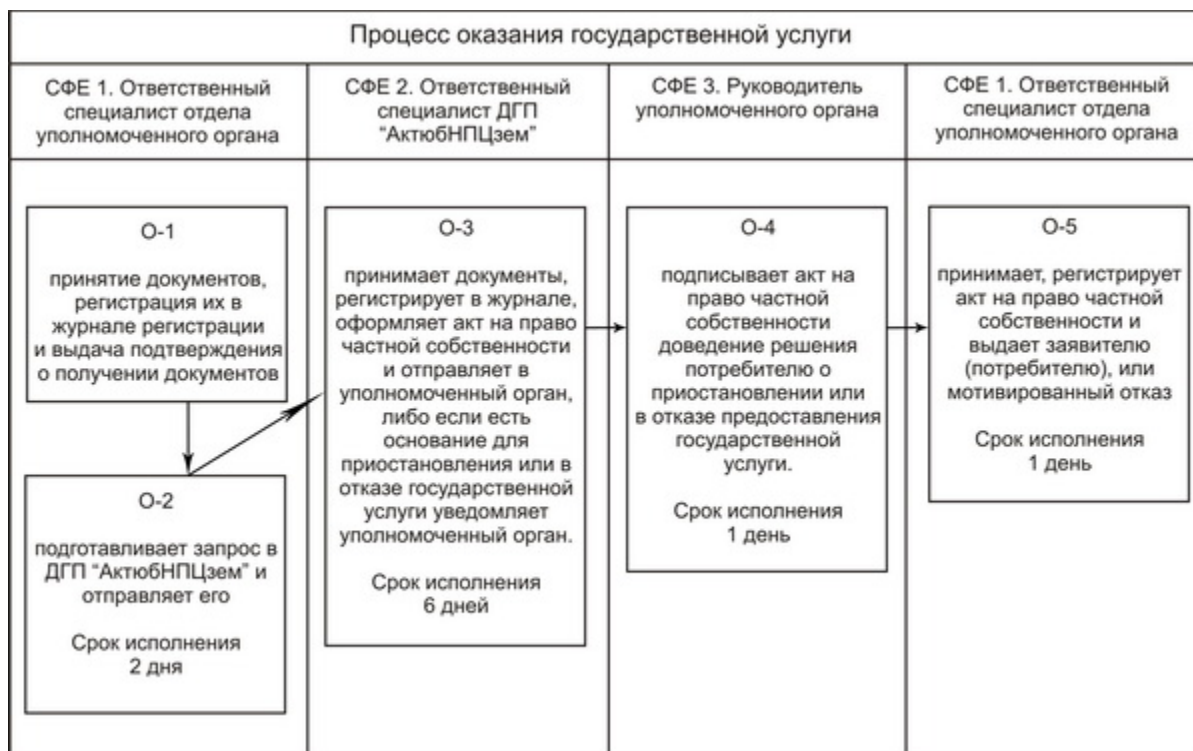
Схема функционального взаимодействия (способ первый)

Приложение 6 к регламенту государственной услуги «Оформление и выдача актов на право постоянного землепользования»