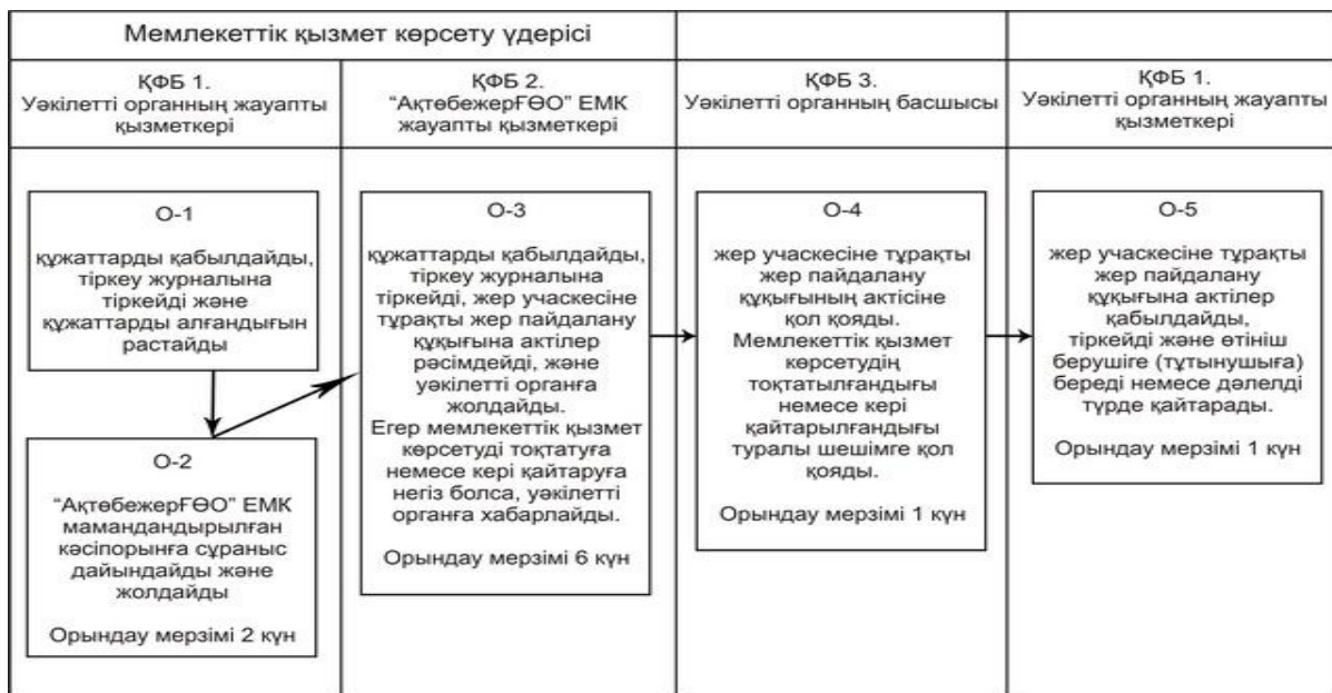
Схема функционального взаимодействия (способ второй)

Приложение 7 к регламенту государственной услуги «Оформление и выдача актов на право постоянного землепользования»