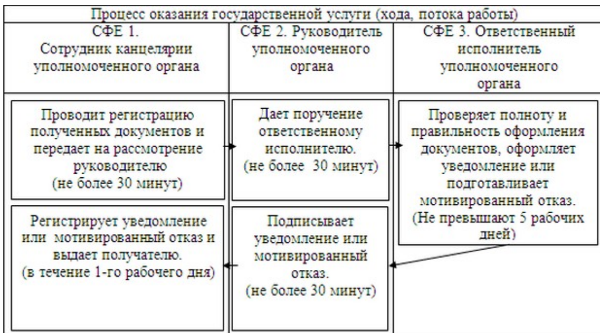
Схема функционального взаимодействия.

2 П р и л о ж е н и е к Регламенту государственной услуги «Представление туристской информации, в том числе о туристском потенциале, объектах туризма и лицах, осуществляющих туристскую деятельность»