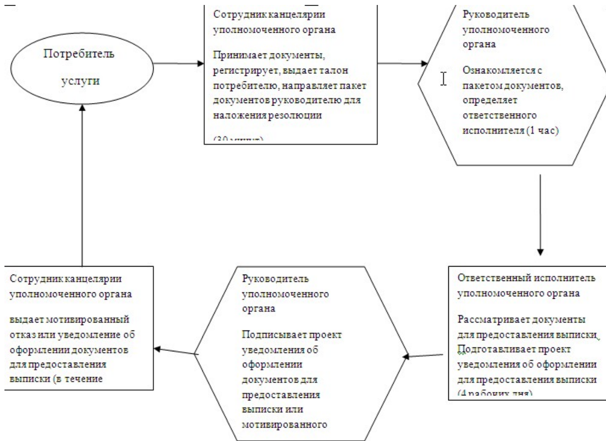
Приложение 5 к Регламенту государственной услуги "Обеспечение бесплатного подвоза обучающихся и воспитанников к общеобразовательной организации образования и обратно домой"