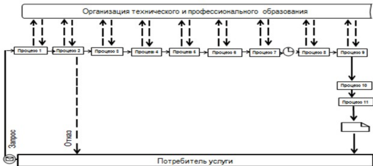
Приложение 4 к регламенту государственной услуги "Прием документов и зачисление в организации образования, осуществляющие подготовку кадров по образовательным программам технического и профессионального образования"