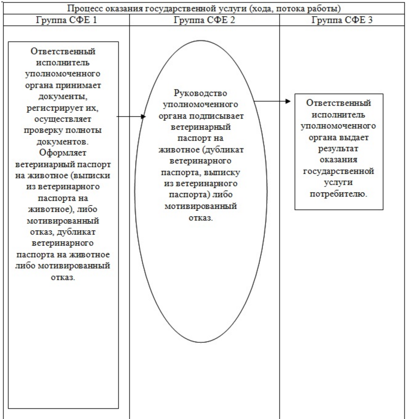
Схема функционального взаимодействия действий в процессе оказания государственной услуги