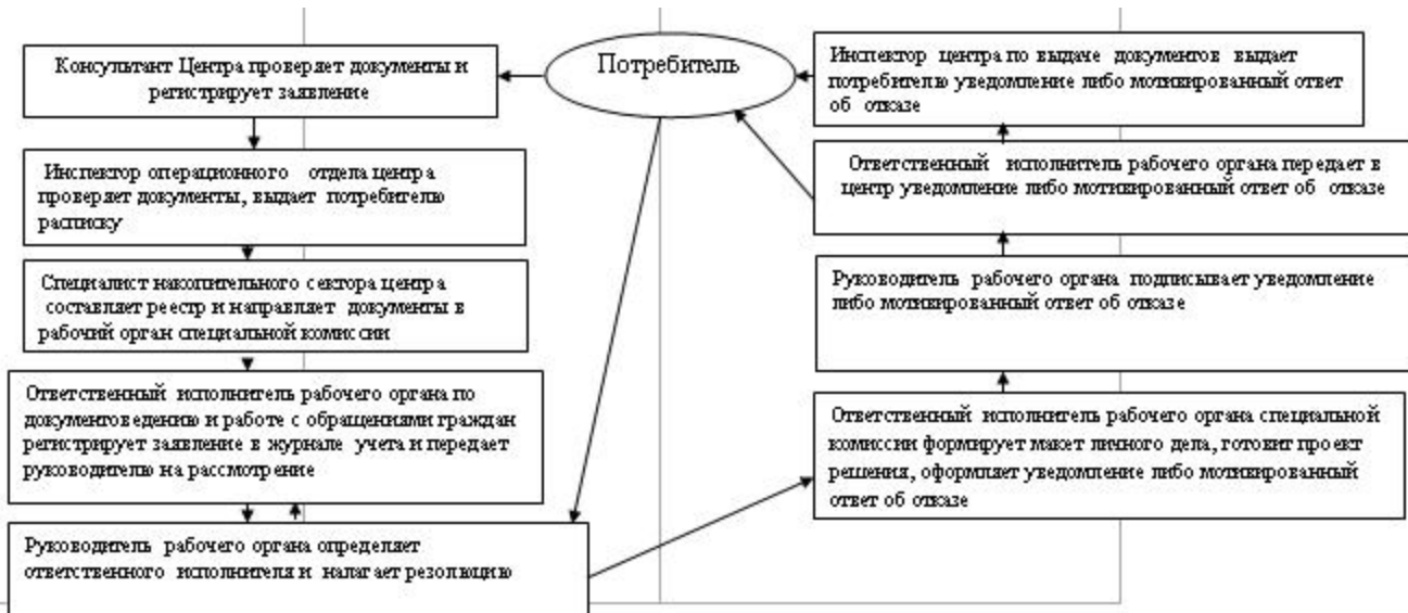
Схема функционального взаимодействия. Процесс оказания государственной услуги. Альтернативный процесс

У т в е р ж д е н п о с т а н о в л е н и е м У л ы т а у с к о г о о т 5 д е к а б р я 2012 г о д а N 30/12