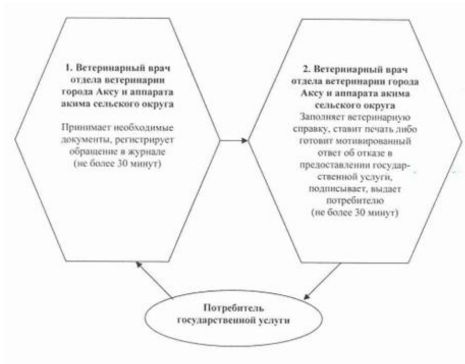
Схема процесса предоставления государственной услуги "Выдача ветеринарной справки"