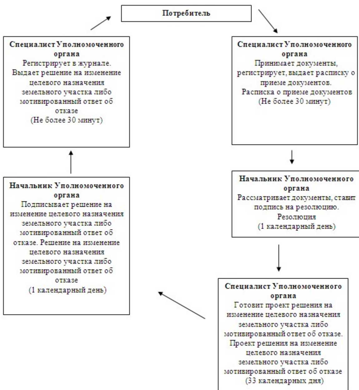
Схема предоставления государственной услуги

к регламенту государственной услуги "Выдача решения на изменение целевого назначения земельного участка" от 28 декабря 2012 года N 352