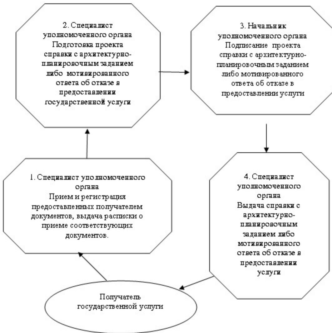
Схема процесса оказания государственной услуги для объектов строительства, указанных в подпункте 2) пункта 7 Стандарта