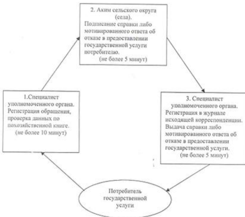
Схема процесса выдачи справки о наличии личного подсобного хозяйства