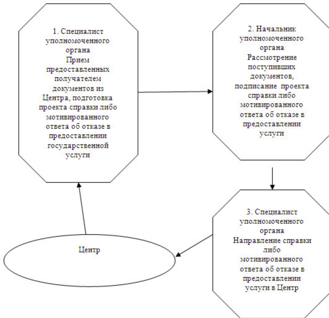
Схема процесса оказания государственной услуги при присвоении, изменении или упразднении адреса объекта недвижимости