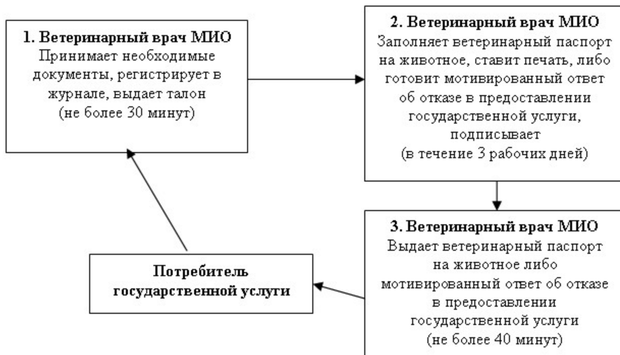
Схема 2. Процесс предоставления государственной услуги «Выдача ветеринарного паспорта на животное» при обращении потребителя для получения дубликата ветеринарного паспорта на животное (выписки из ветеринарного паспорта на животное)