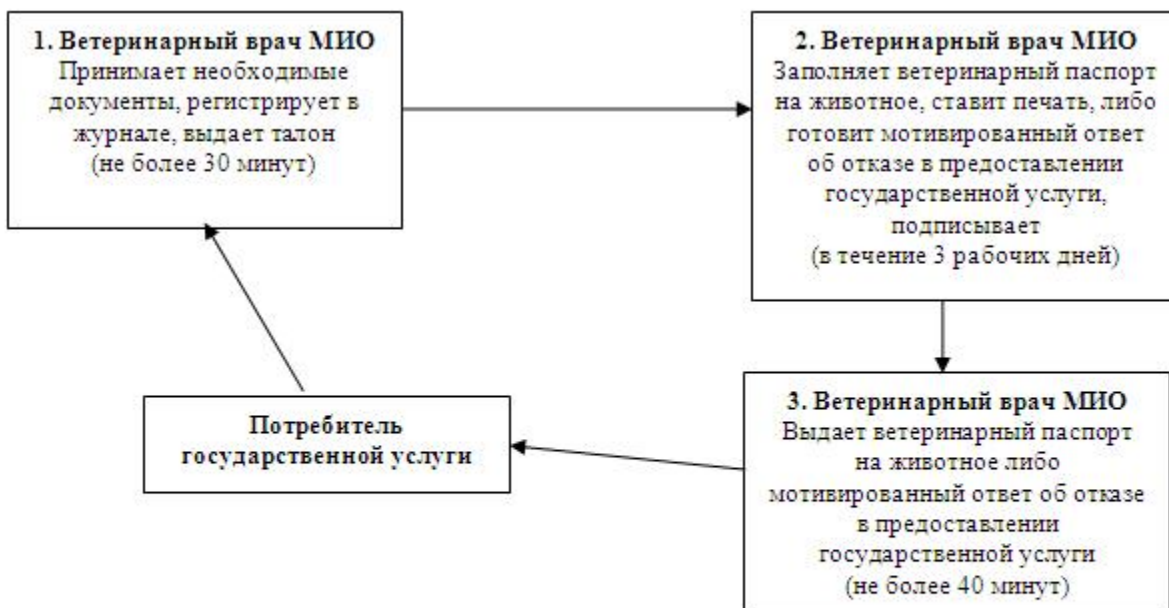
Схема 2. Процесс предоставления государственной услуги «Выдача ветеринарного паспорта на животное» при обращении потребителя для получения дубликата ветеринарного паспорта на животное (выписки из ветеринарного паспорта на животное)