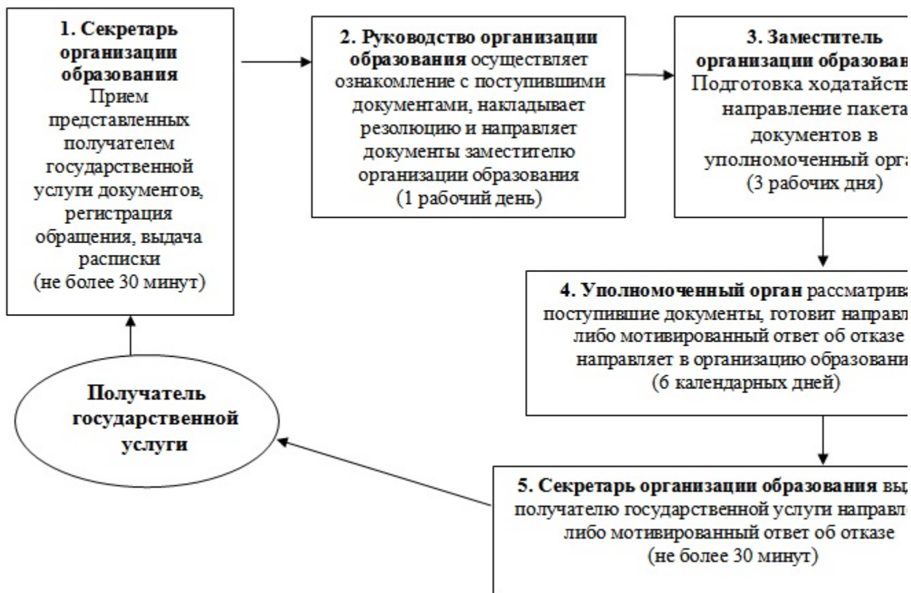
Схема 2. Описание действий СФЕ при обращении получателя государственной услуги в уполномоченный орган