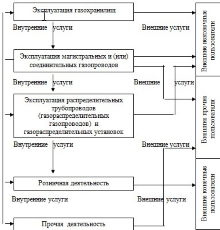
Схема направлений деятельности газотранспортных и (или) газораспределительных организаций

Приложение 2 к Правилам ведения раздельного учета доходов, затрат и задействованных активов субъектами естественной монополии, оказывающими услуги по хранению, транспортировке товарного газа по соединительным, магистральным газопроводам и (или) газораспределительным системам, эксплуатации групповых резервуарных установок, а также транспортировке сырого газа по соединительным газопроводам